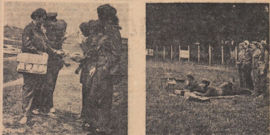
În cadrul cercurilor tehnico-aplicative se însușesc tainele diferitelor discipline, cum ar fi, de pildă, meseria armelor și cea tehnico-sanitară.

M. POPOVICIU Institutul politehnic din Timișoara