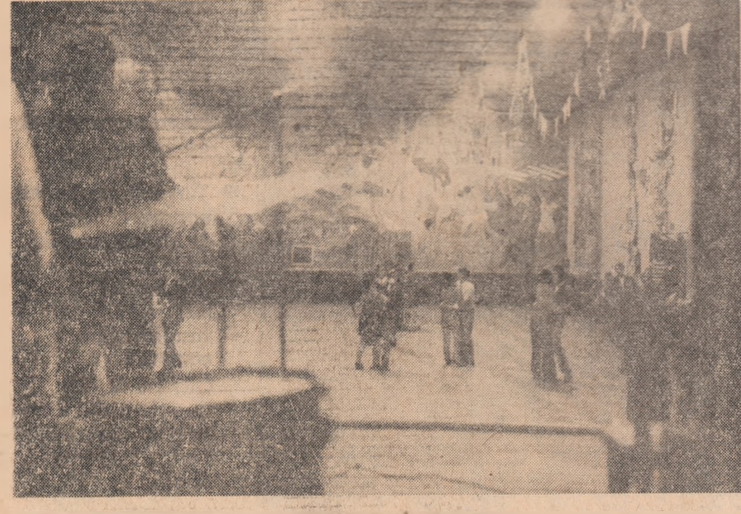
Săli spațioase, proiectate să cuprindă peste o mie de tineri fiecare, stau goale în multe „seri de dans”...