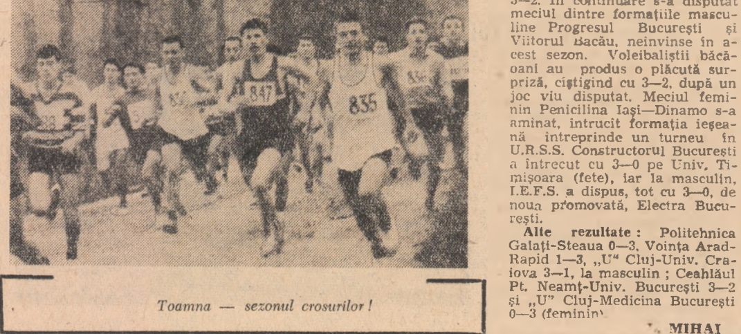
Toamna - sezonul crosurilor!

Acum avem șapte secții: volei, handbal, oină, fotbal, șah, tenis de masă și lupte, sporturi cu o frumoasă tradiție în aceste locuri. Consiliul asociației noastre se întrunește săptămînal și pune la punct programul cu toate acțiunile în curs de desfășurare; există în permanență o evidență clară. Pentru fiecare secție s-a numit un instructor, care se ocupă de pregătirea echipelor; fotbal - în campionatul județean, oină - în campionatul republican și „Cupa U.T.C.” volei și handbal, în competițiile județene.