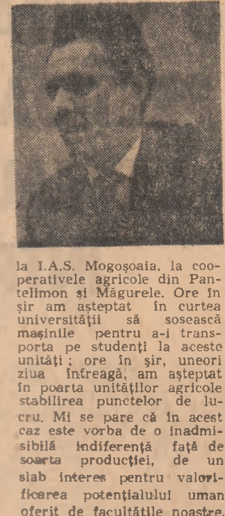
la I.A.S. Mogoșoaia, la cooperativele agricole din Pantelimon și Măgurele. Ore în sir am așteptat în curtea universității să sosească mașinile pentru a-i transporta pe studenți la aceste unități; ore în sir, uneori ziua întreagă, am așteptat în poarta unităților agricole stabilirea punctelor de lucru. Mi se pare că în acest caz este vorba de o inadmisibilă indiferență față de soarta producției, de un slab interes pentru valorificarea potențialului uman oferit de facultățile noastre.

Tovarășul Zorin Zamfir, prorectorul Universității din București, ne spune: se împlineste o lună de cînd studenții noștri participă la muncile patriotice în agricultură. Zilnic 1.500. În general remarcăm dorința entuziastă a studenților de a contribui la această acțiune ce concentrează, sub o formă sau alta, eforturile întregului popor. Pentru dăruirea cu care au lucrat și remarcă studenții de la facultățile de limbi și literatură germanice și slave, chimie și geografie. În general, între conducerea Universității și unitățile agricole beneficare a existat o bună colaborare. Exemplară din acest punct de vedere este colaborarea cu I.A.S. Mihăilești și I.A.S. Bragadiru. Specialiștii acestor unități se află continuu printre studenții noștri, li inițiază în activitatea ce o au de desfășurat, contribuie operativ la remedierea neajunsurilor. Surprinde neplăcut, însă, nepăsarea cu care studenții noștri au fost primii la Institutul de cercetări legumicole de la Vidra.