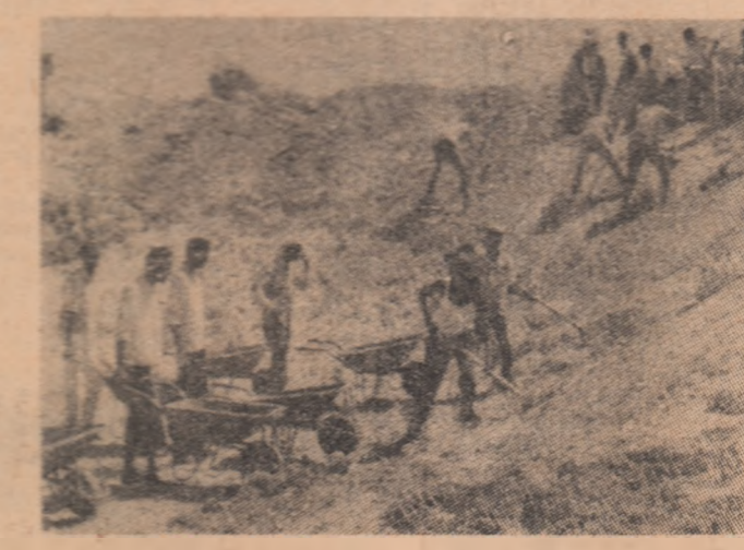
Studenți din Somalia ajutînd la construirea unui-nou obiectiv economic

Agencia V.N.A. informează că aviația S.U.A. a intrerprins, la 27 octombrie, raiduri de bombardament asupra orașului Dong Hoi, din provincia Quang Binh, și asupra mai multor centre populate din provinciile Thanh Hoa, Nghe An și Ha Tinh. De asemenea, artileria de la bordul navelor americane, aflate în apropierea coastelor nord-vietnameze, a bombardat centre populate din provinciile Nghe An și Ha Tinh. În legătură cu aceste bombar-