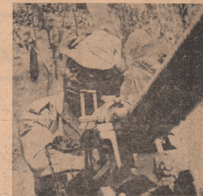
O imagine de pe frontul din Angola, un tânăr combatant al forțelor patriotice gata să intre în acțiune

Opinia publică din țara noastră și-a exprimat profundă ei satisfacție pentru rezultatele cu care s-a încheiat vizita tovarășului Nicolae Ceaușescu în Belgia și Luxemburg, exprimând recunoștință pentru eforturile neobosite ale conducătorilor partidelor și statelor noastre în slujba cauzei păcii și înțelegerii între popoare. Această vizită reprezintă o puternică demonstrație a prezentei activități a României socialiste în viziunea internațională, a contribuției ei la afirmarea tendințelor pozitive de destindere, de conlucrare pașnică a națiunilor, a dreptății popoarelor de a se dezvolta neîntrerupt, potrivit voinței lor suverane.