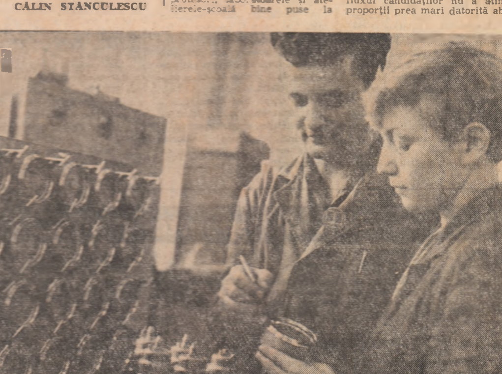
La întreprinderea „Balanța” din Sibiu, meseria în mecanică fină se învață cu răbdare și perseverență.