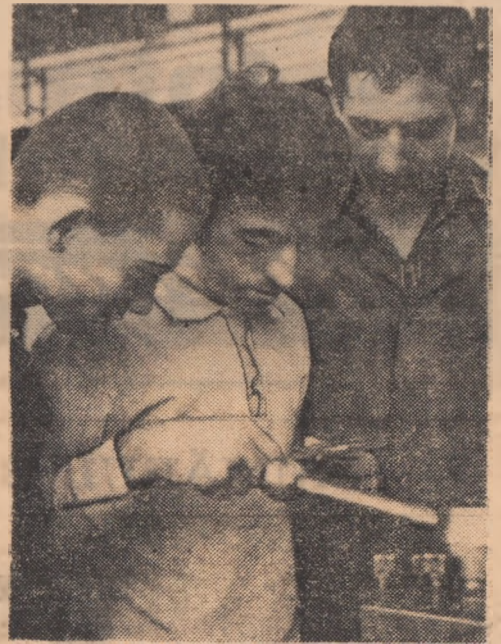
Ca să lucrezi bine, trebuie să știi să și controlezi bine