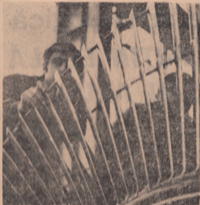
„Harfa” pasului profesional