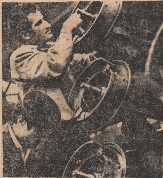
Coordonatele întrecerii: repede, bine, economicos

Redactorul suplimentului: ROMULUS LAL