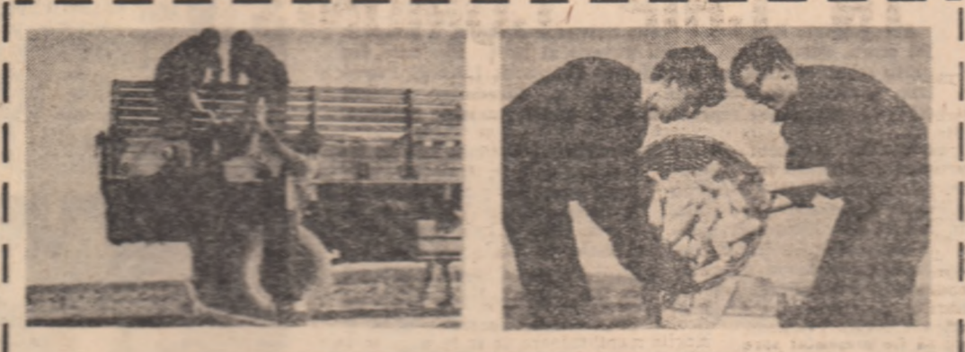
DIN ALBUMUL MUNCII PATRIOTICE

In aceste zile, lucratorii otorelor din judetul Hunedoara snt spriginiti de mii de studenti, studenti si muncitori pentru a striga cu ei mai grabnic rotul acestor ani.