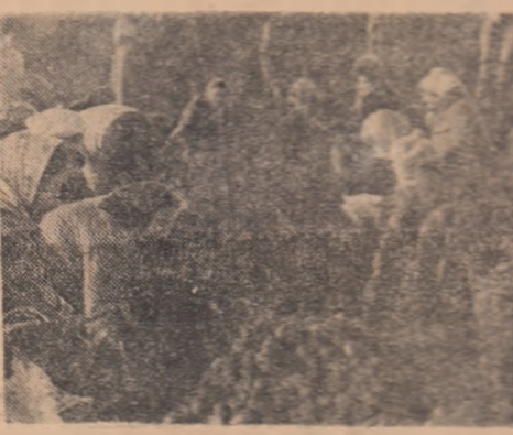
Virșnici sau tineri, muncitori sau studenți, elevi sau funcționari, în această dimineață au un singur țel: depozitarea a cît mai multă cartofi

Raidul nostru l-am început pe taratele fermei agricole „Gina” din cadrul I.A.S. Popești-Leordeni într-o zi obișnuită. Furcicul de oameni umplea cîmpul hărniciei. La sfîrșitul recoltei, 250 de studenți de la Academia de studii economice, facultățile de finanțe și comerț interior, alți 120 de elevi ai școlii profesionale din comună, veniseră aici dis-de-dimineață să încheie culesul rădăcinoaselor, pătrunjel și moroco, început cu zile în urmă de colegi ai lor. Mii de tineri au muncit din răsputeri, cu hărnicie și dăruire, smulgînd pămîntului cantități însemnate de roade. Cei pe care i-am întîlnit noi, înarmați cu săpîlți și furci, ajutați de tractoare dotate cu mijloace de dislocare, începuseră, deja, acțiunea pentru realizarea normelor stabilite: cîte 50 de kilograme pentru fiecare din ei. Deși condițiile sînt grele datorită umidității