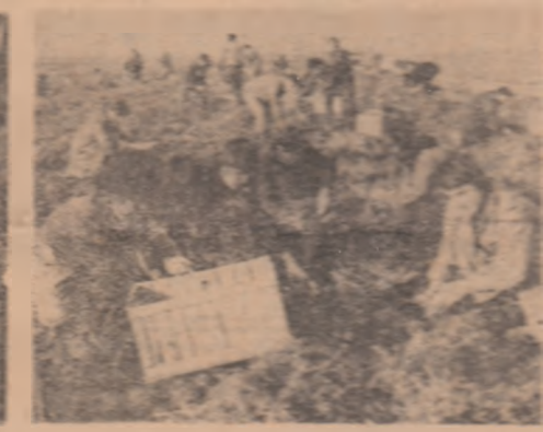
La Popești-Leordeni, pe taratele fermei agricole Gina, încă 250 de brațe tinere începeau pămîntul pentru a-i smulge roadele viștie la seceră

pentru realizarea obiectivelor acestei dimineți de lucru: sortarea și încheierea a 200 tone, depozitarea altor 200, în timp ce a parte dintr-o echipă se ocupă de culesul rădăcinoaselor și pătrunjelului. În acest timp, o altă echipă se ocupă de culesul morocului și de depozitarea acestuia în saci.