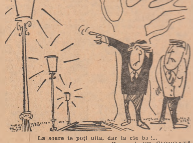
La soare te poți uita, dar la ele ba!...