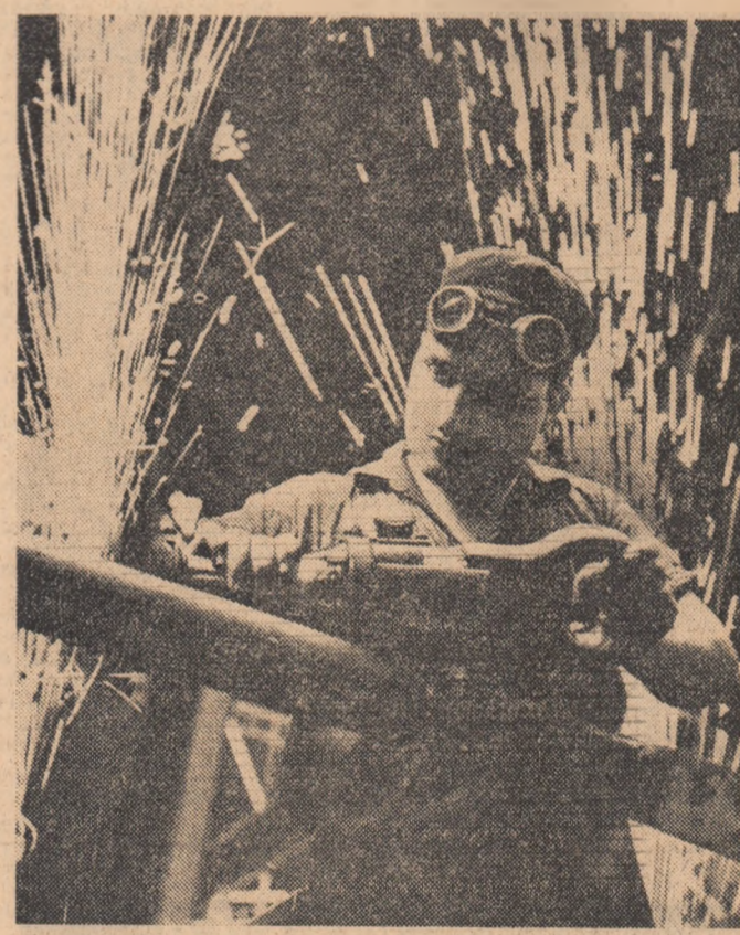
„Foc de artificii”