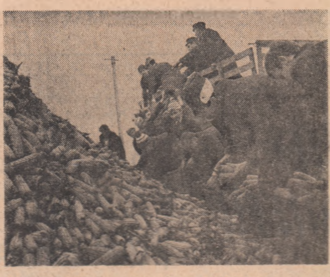
I.A.S.-Pitești. Elecții școlii profesionale C.F.R. ajută la transportul porumbului la bazele de recepție.