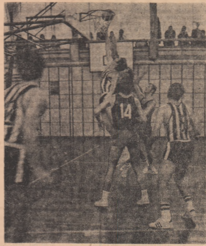
Rugbi România - R. F. a Germaniei 10-11

RUGBI O MARE DECEPTIE Infringerea echipei de rugbi a României de către reprezentativa R. F. a Germaniei, ieri, pe stadionul Dinamo din Capitală constituie una din marile surprize ale actualului sezon rugbistic. Eșecul suferit de rugbiștii români ne îndreptățește să tragem un semnal de alarmă serios, deoarece până în prezent echipa noastră a avut o evoluție deosebit de bună, fiind în fruntea clasamentului. În acest meci, însă, echipa noastră a prezentat o performanță deosebit de slabă, ceea ce este un fapt care nu poate fi ignorat.