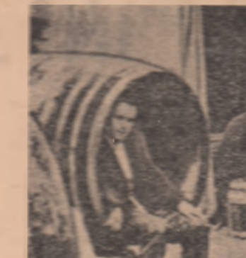
Prin această formă originală de protest în plină stradă, studenții din Amsterdam strigă împotriva lipsei de locuri în cămine și a scumpirii chimicilor.