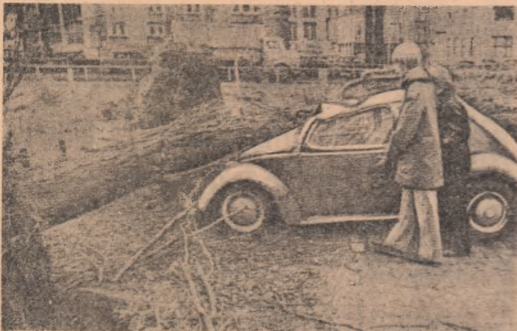
Urmările puterimilor furtivi care au bintuit zilele trecute o parte a Europei occidentale și nordice. Imagine din orașul vest-german Bremen, unde circulația a fost blocată

● APROAPE 30 DE MILIOANE de brazilieni s-au prezentat în fața urnelor pentru a ale-