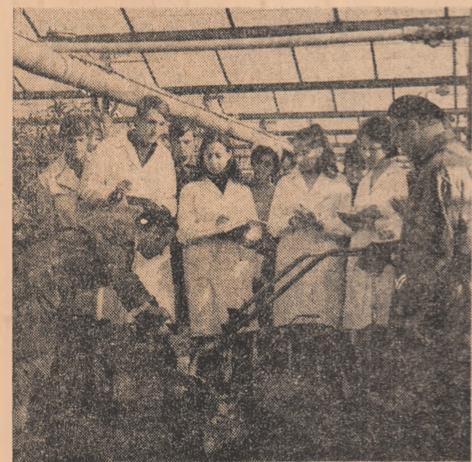
Studenții din anul V al Facultății de horticultură a Universității din Craiova în practică la I.A.S. Izalnița, județul Dolj