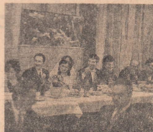
La Năsaud, în această toamnă, ca în atâtea locuri în țară, doi uteciști au făcut împreună primul pas în viață printr-o nuntă a tineretului.