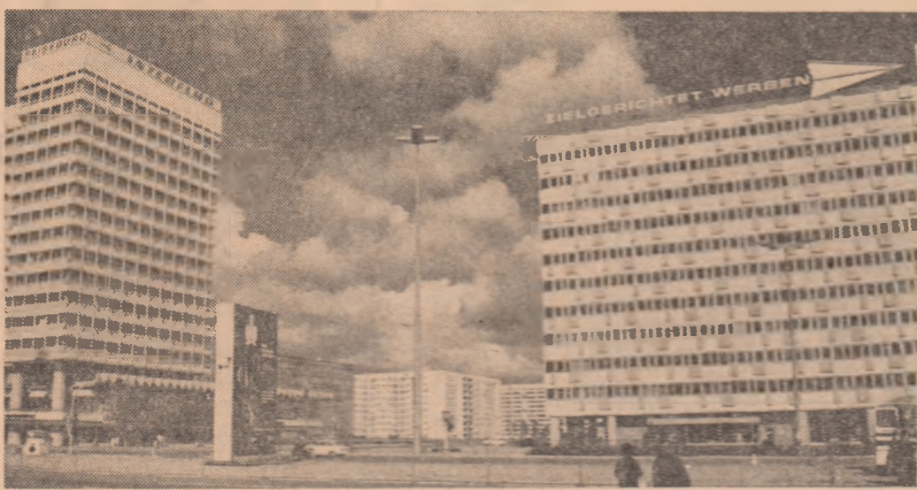
R.D. GERMANIA - Peisaj arhitectonic modern la Berlin