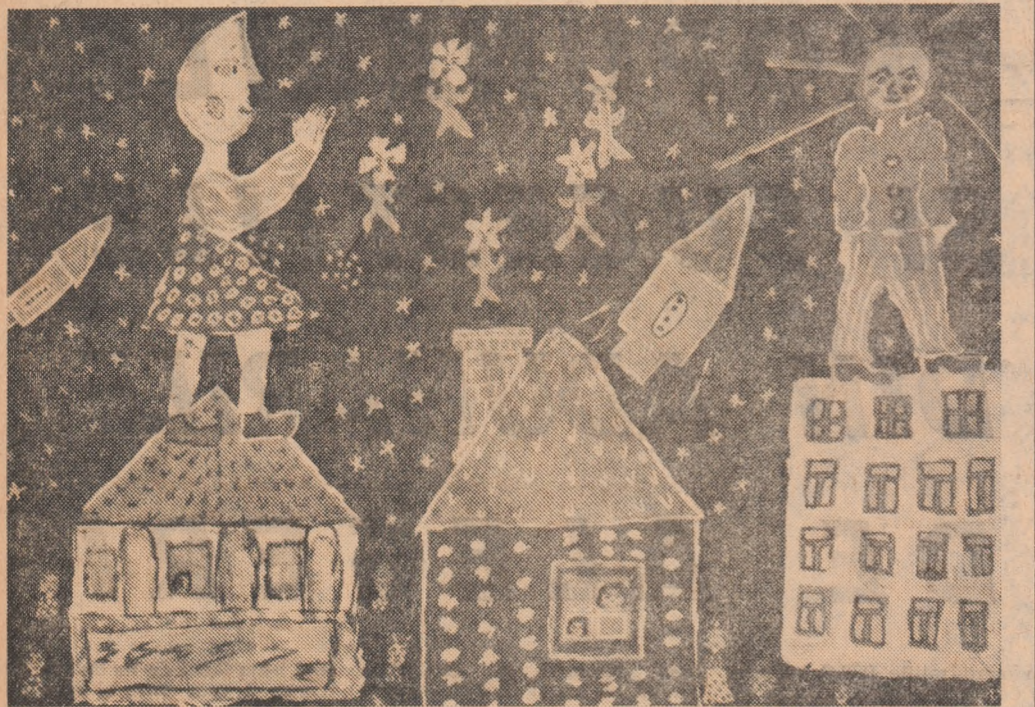
„Seară Vulturească” de POPA ZENAIIDA