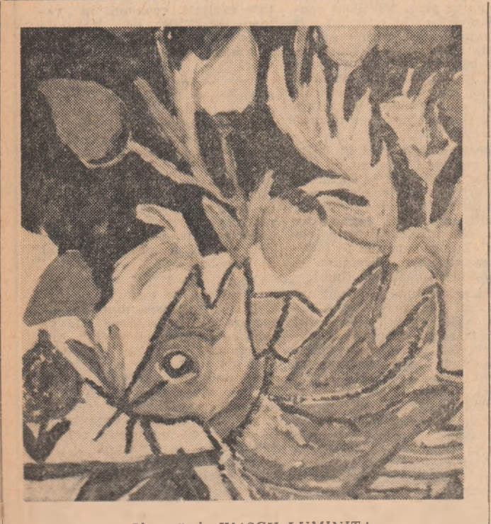
„Glastră” de IVAȘCU LUMINIȚA