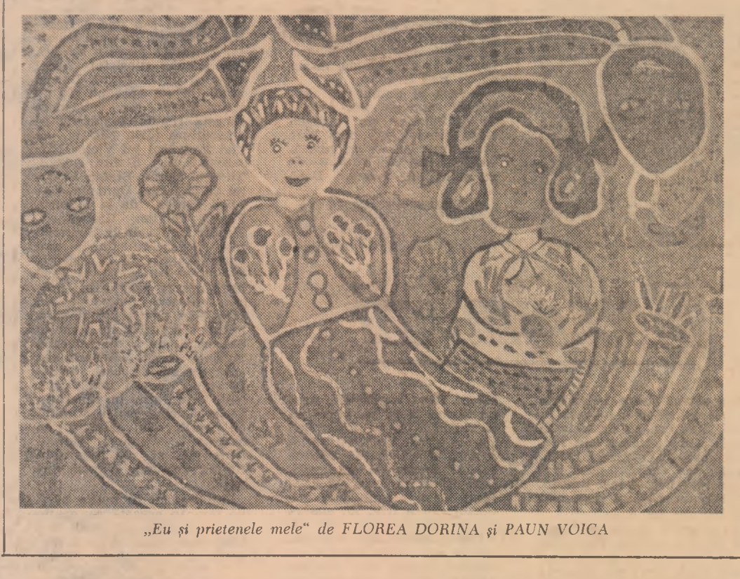
„Eu și prietenele mele” de FLOREA DORINA și PAUN VOICA