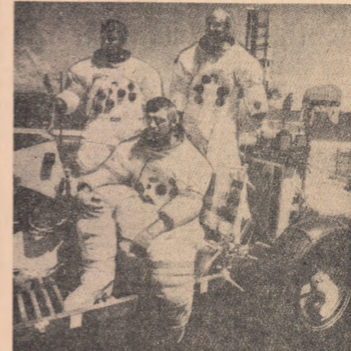
S.U.A. — Cei trei cosmonauți de la bordul navei „Apollo-17” în timpul pregătirilor pentru zborul spre Lună

La această săptămîna culturală românească, care s-a bucurat de un frumos succes, au participat oameni de cultură, ziariști din Madrid, membri ai coloniei române și un numeros public.