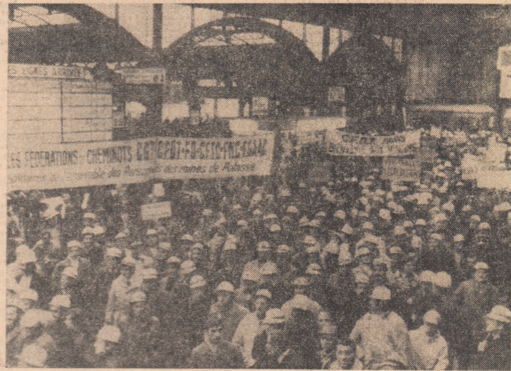
Franta: aspect de la demonstrațiile care au insotit greva muncitorilor de la minele de potasiu din Alsacia. Greva, care a durat o luna de zile a avut in centrul obiectivelor ei imbunatatirea conditiilor de viata ale minerilor.

NUMĂRAREA VOTURILOR în cele 35 de circumscripții electorale din Republica Irlanda relevă că, în cadrul referendumului popular, de la 6 decembrie, covârșitoarea majoritate a cetățenilor prezenti la urne s-a pronunțat în favoarea amendamentului constituțional propus de guvernul Lynch, privind abrogarea prevederilor în vîrteala căreia Biserica catolică deținea în stat o „poziție specială”. Un vot favorabil masiv a fost acordat, cu același prilej, legislației privind reducerea limitei de vîrstă a majorității electorale de la 21 la 18 ani.