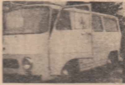
Proletari din toate țările, uniți-vă!

LUMEA IDEILOR • Dialog cu tinerii: A FI OMUL EPOCI IN CARE TRĂIEȘTI • Anchetă nouă: PROFESIILE VI- TORULUI, VIITORUL PROFESILOR ȘTIINȚĂ • ȘTIINȚĂ • REALIZĂRI TEHNICE IN PREMIERA • Cronica ipotezelor: REZOLUȚIILE - O VALOROASĂ MATERIE PRIMĂ