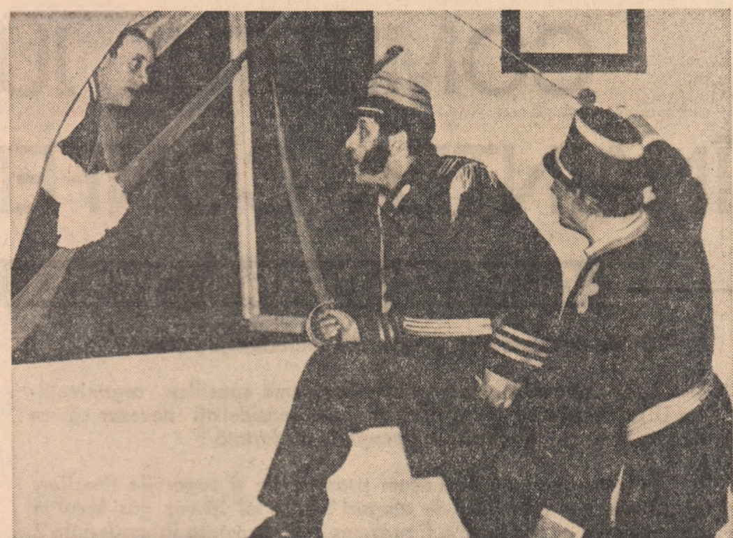
Scenă din spectacolul cu „O noapte furtunoasă” de I. L. Caragiale, în interpretarea actorilor amatori ai Teatrului Popular din Rimnicu-Vilcea

categorye s-au regăsit: în romanul despre viața lui Jack London de Irving Stone, în personajele lui Drebreanu, în situațiile din romanul „Pe aripile vântului” de M. Mitchell (o funcționară și o absolventă de liceu) sau într-o situație din cărțile de aventuri ale lui H. Zinca (strungarul Al. B. de la Uzina „Independența”).