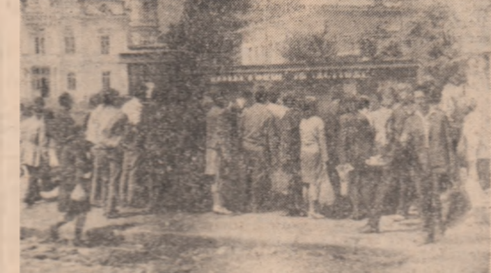
În centrul orașului Târgoviște — din inițiativa Comitetului municipal U.T.C. — a fost amplasat un mare panou de sticlă în fața unui grup de „Reflector în acțiune”. Sînt prezentate în diverse aspecte activitatea muncii plină de entuziasm, inițiativa muncitorilor îndreptată să contribuie la îndeplinirea sarcinilor de producție, a circulației înainte de termen. De asemenea, sînt prezentate în mod critic fapte și mentalități regăsite în societate, în special a producătorilor. Din nou, scrii o excelentă inițiativă — asemănătoare cu cea realizată de către tinerii din Oradea (prezentată în cadrul rubricii noastre) — pe care o recomandăm și altor organizații U.T.C.

— aceasta este cifra însoțită de aplicații în acest an în producție la întreprinderea „Electromures” din Tg. Mures. Eficienta lor economică a creșterea trei milioane lei. Din catalogul nouăzeci și șapte de produse de montaj elemente de radiatoare electrice cu sursă tehnologică pentru realizarea în condiții mai bune a unor produse electrocasnice, reprezentarea a peste 25 produse de dimensiuni mici și funcționalitate ridicată, reducerea greutatea. Încalzirea materialelor defectare.