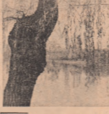
Toamnă dorită, toamnă a cuceririlor de vînt — astfel își intitulă unul din corpurile noastre competiția foto-trințată pe adresa „Actualității“...