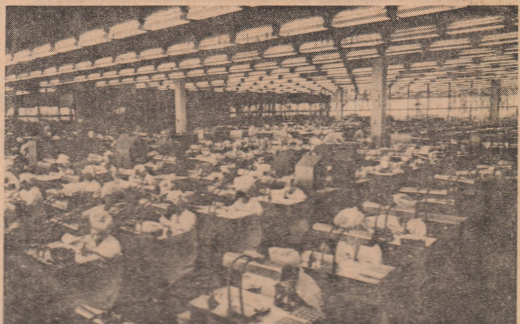
U.R.S.S. - Aspect de lucru de la fabrica de cazari nr. 7 din Moscova, care își exporta produsele în 70 de țări ale lumii

La 14 decembrie, în cadrul sesiunii de lucru a grupului de lucru cvadripartit, au avut loc convorbirile cvadripartite de la Paris. Grupul de lucru cvadripartit este format din reprezentanți ai URSS, SUA, Franței și URSS. În cadrul sesiunii de lucru, au fost discutate problemele legate de realizarea acordului de la Helsinki și de stabilirea unei linii de acțiune comune în ceea ce privește problema Orientului Mijlociu. În cadrul sesiunii de lucru, au fost discutate și problemele legate de realizarea acordului de la Helsinki și de stabilirea unei linii de acțiune comune în ceea ce privește problema Orientului Mijlociu.