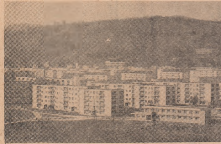
MEDIAȘ: Noul cartier de locuințe Gura Cimpului, în plină extindere și modernizare