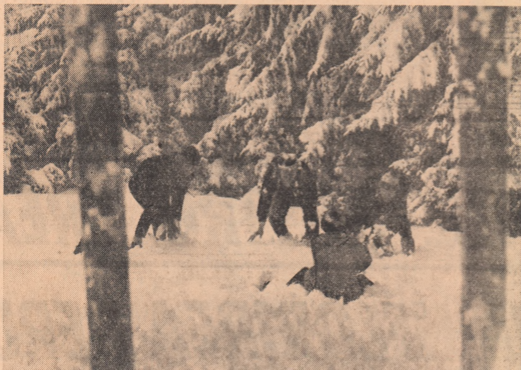
Din plăcerile iernii

pună la dispoziție bibliotecile, materialul sportiv, bazele sportive, săile pentru organizarea reuniunilor. În acest an, elevii vor fi ajutați și să organizeze revelațiile, li se oferă această posibilitate, chiar și o anume sumă de bani, pentru a-l sărbători împreună, în școli, ori într-o altă sală potrivită evenimentului. — Dar taberele? — Nu lipsesc din agenda de vacanță. Nici excursiile. Multe școli au perfectat ele însele prin B.T.T. ori O.N.T. tabere proprii, excursii; peste 40.000 elevi vor fi trimisi, cite 7 zile, la odihnă în tabere turistice, iar alții în tabere sportive. C.C. al U.T.C. organizează o tabără de odihnă și instruire pentru activul U.T.C. din liceele agricole; la nivel județean, se vor putea organiza tabere pentru membrii activelor U.T.C. din școli, de 7 zile, timp în care se va putea realiza și o instruire adecvată cu problemele muncii de organizație. Fără îndoială, că tot ce am spus aici este o mică parte din ceea ce va însemna vacanța pentru că, cu certitudine, ea va fi îmbogățită cu multe idei.