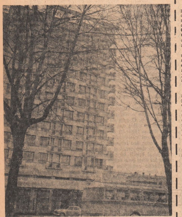
Noul hotel „Zimbru” din Cimpulung Moldovenesc