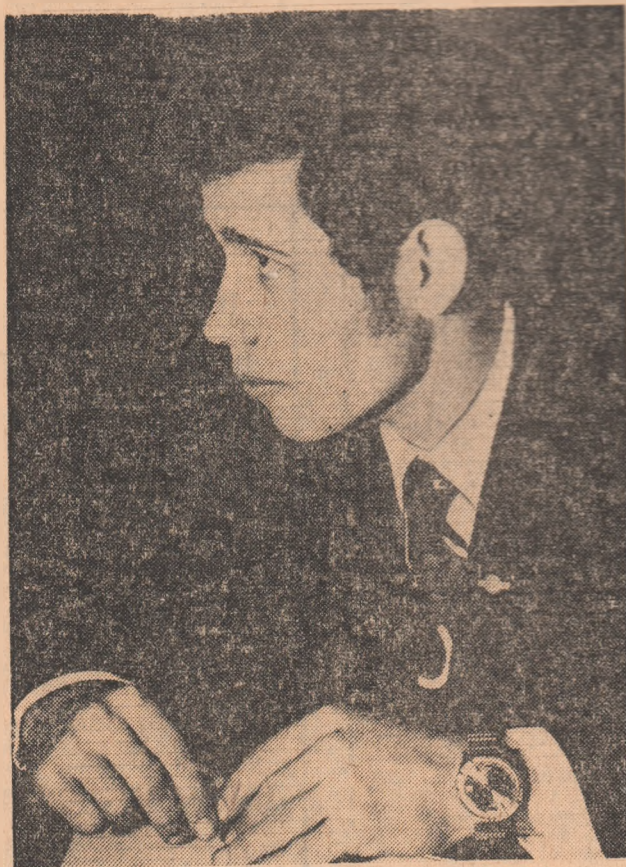
Ce-i scriu tinerii câștigătorului „Strungului de aur” (Pag. a III-a)