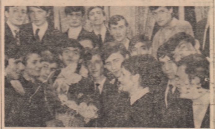
Rămas bun școlii 35 de foști elevi ai anului III A de la Școala profesională „Infrățirea” din Oradea...