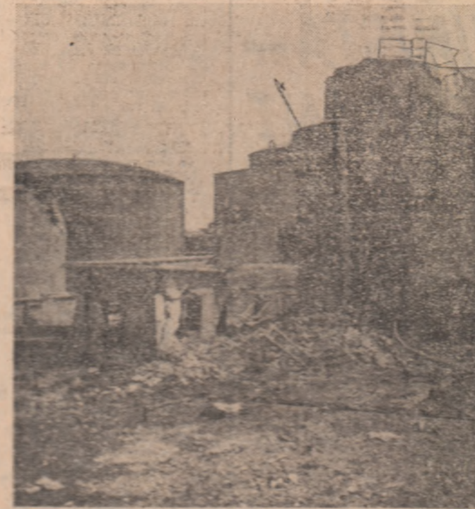
Ca multe alte obiective economice din țară — și așa destul de puține și rudimentare — care au servit ca țintă bombardamentelor în timpul războiului; și Rafinăria din Ploiești a fost transformată complet în ruine. Nici o instalație, nici o capacitate de producție n-a mai rămas în stare de funcționare.