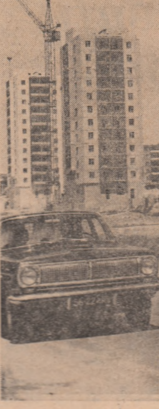
U.R.S.S. — Noi blocuri de locuințe în orașul Cimkent

La 20 decembrie, populația Vietnamului de sud, întregul popor vietnamez sârbătoresc împlinirea a 12 ani de la crearea Frontului Național de Eliberare din Vietnamul de sud. Născut din voința și aspirațiile cele mai fierbinți ale populației sud-vietnameze de a-și orîndui viața în deplină libertate, potrivit intereselor sale fundamentale, Frontul Național de Eliberare s-a afirmat ca reprezentant autentic și legitim al locuitorilor Vietnamului de sud. În scurt răstimp, F.N.E. care și-a asumat de la bun început sarcina istorică de a iniția unitatea tuturor forțelor patriotice în vederea eliberării țării, pentru independență și democrație, pentru neutralitate și reunificarea pașnică a patriei, a devenit catalizator eficient al mișcării patriotice, al luptei împotriva agresiunii americane. După cum se știe, cei 12 ani care au trecut de la acest eveniment de o deosebită însemnătate au stat sub semnul unor strălucite victorii ale mișcării de eliberare condusă de F.N.E. și de Guvernul Revoluționar Provisoriu al Republicii Vietnamului de Sud.