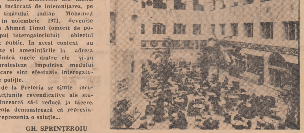
ELVEȚIA. — După trei ani de lucrări de renovare și modernizare, Universitatea „Alma Mater” din Zürich și-a redeschis recent porțile

● EDMOND LEBURTON, însărcinat de regele Baudouin cu formarea noului guvern belgian și-a continuat, luni, consultările cu liderii unor partide în vederea soluționării crizei politice declanșate la 22 noiembrie. Pe de altă parte, Leburton a anunțat că a elaborat marile linii ale programului guvernamental, pe care îl va supune în cursul acestei săptămîni examinării diverselor partide reprezentate în Parlament și întrucîtva să participe la negocierile coaliției guvernamentale. Observatori politici din Bruxelles emit părerea că noul guvern belgian nu va putea fi constituit înainte de 1 ianuarie 1973.