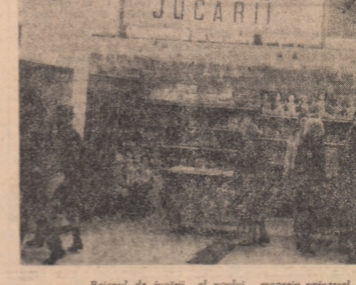
Rational de jucării „al noștri” magazin universal „Moldova” din Iași.