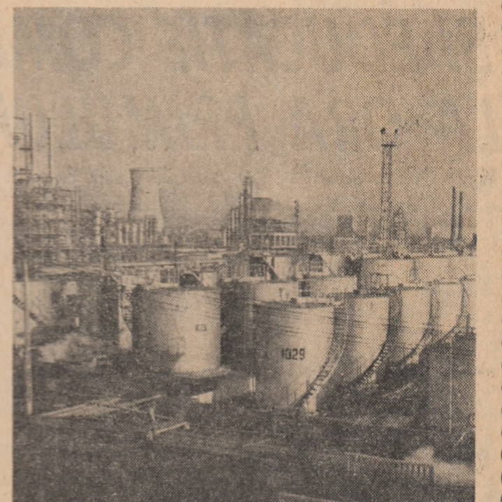
Încă din primul an de libertate, Partidul Comunist Român a pus în fața poporului ca sarcină centrală, refacerea țării, refacerea economiei distruse de război. Fonduri uriașe au fost alocate an de an pentru reconstrucție. Rafinăria din Ploiești este unul din obiectivele reconstruite.