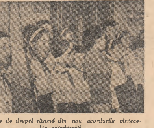
Sub faldurile de drapel răsînd din nou acordurile cîntecelor plinieresc.

Cu ocazia aniversării centenarului, vineri și sîmbătă s-au desfășurat ample manifestări culturale-artistice pe care elevii, cadrele didactice și invitații le-au închinat în aceeași măsură, ca un omagiu, împlinirii unui sfert de veac de la proclamarea Republicii. Ceremonialul plinieresc, adunarea festivă a organizației U.T.C., vernisajul expozițiilor elevilor, dezvoltarea bustului renumitului istoric și patriot Eudoxiu Hurmuzachi au fost tot attea prilejuri de aleasă bucurie. În semn de omagiu și respect, a fost adresată o telegramă C.C. al P.C.R., tovarășului Nicolae Ceaușescu.