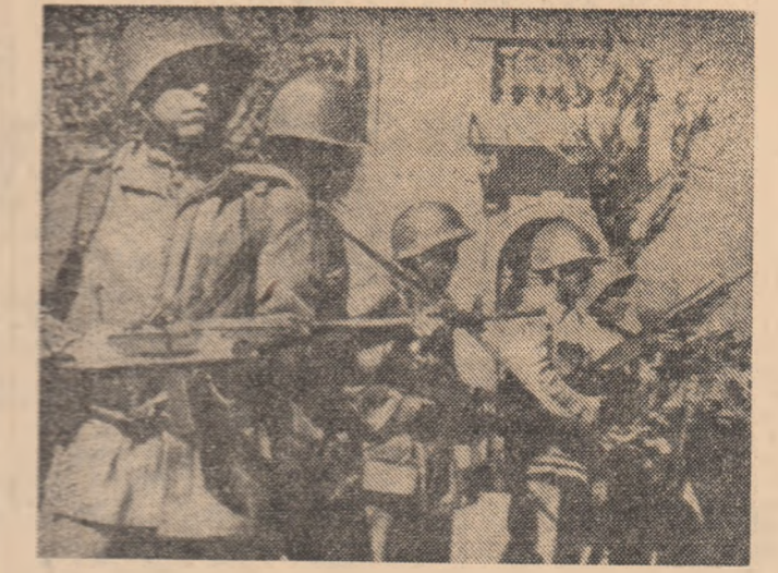
Unități militare pe străzile capitalei boliviene în cadrul intensificării represunilor anti-democratice.

● CASA A DIFUZAT PRIMELE OPT FOTOGRAFII ÎN CULORI REALIZATE DE ȘTIINȚIIȘII ROȘTEI MIKHAEL APOLLONOV, care mai întâi realizase două ale, calificată drept „fantastică” de agreste spațiile îndepărtate. Pământul văzut de la mare distanță ca un glob albastru, brăzdat de zone albe și maronii. În imagine se pot distinge cu claritate contururile Africii, albul strâmbor al Americii, albastrul via al oceanului Atlantic și al Indian, scopurile parțial de vîrtejuri norilor. Într-un plan mai îndepărtat se văd Mediterana, coasta sudică a Asiei, Insulele Madagascar.