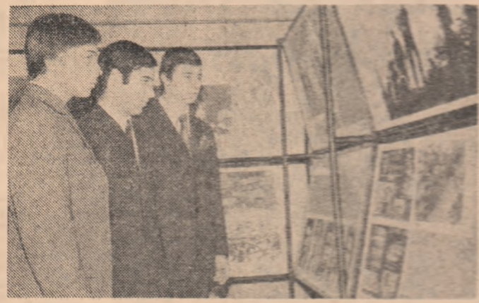
La deschiderea expoziției.