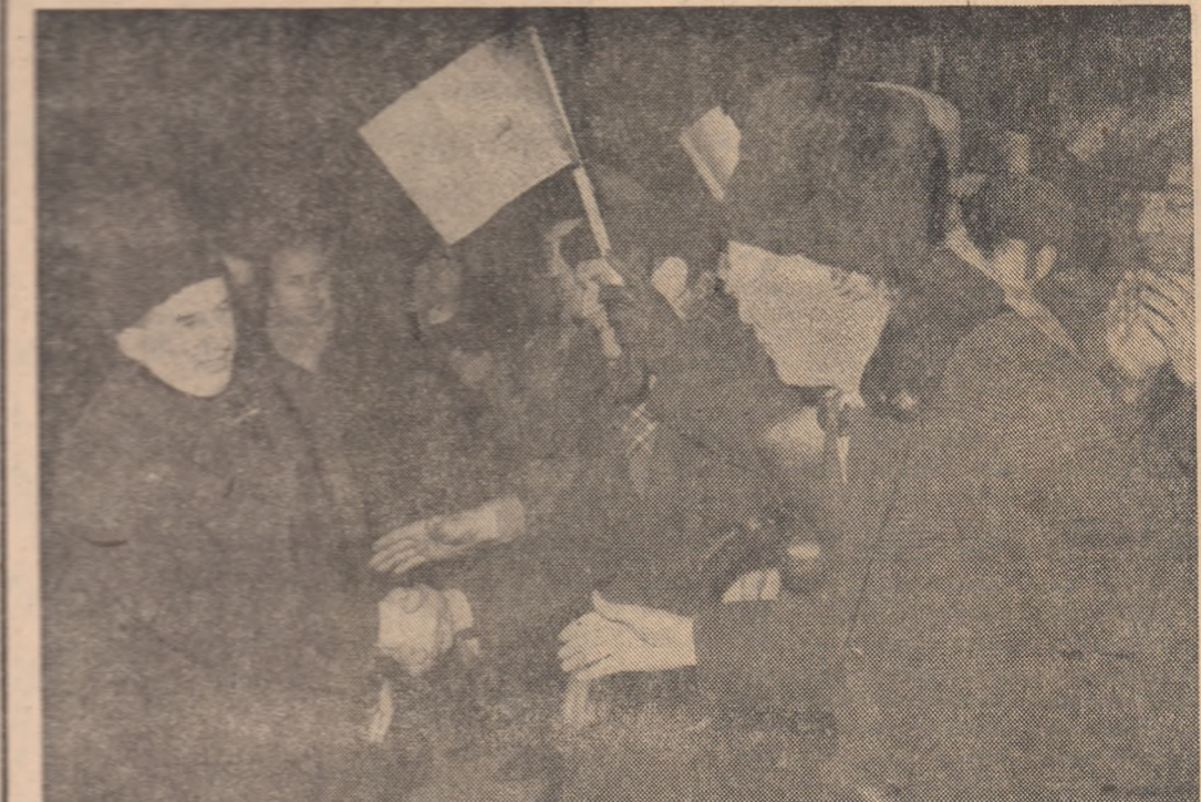
Tovarășul Nicolae Ceaușescu a fost întîmpinat cu multă căldură de mii de bucurășteni.