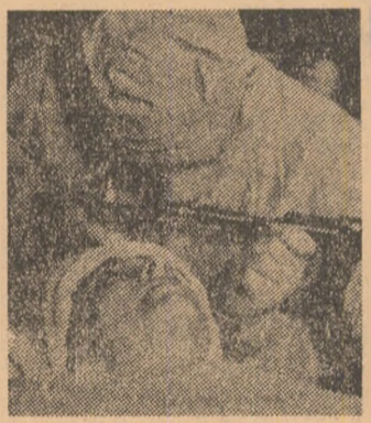
Rubrică realizată de EM. RUCAR

Domeniile medicinei în care se experimentează utilizarea laserului sînt dintre cele mai variate. Astfel, dentiștii iau în considerare posibilitatea folosirii laserului în locul trezilor pentru carii. Se fac, de asemenea, cercetări privind eficacitatea laserului cu bioxid de carbon în chirurgia cancerului. S-a constatat că laserul este superior altor bisturiului cit și cuțitu-