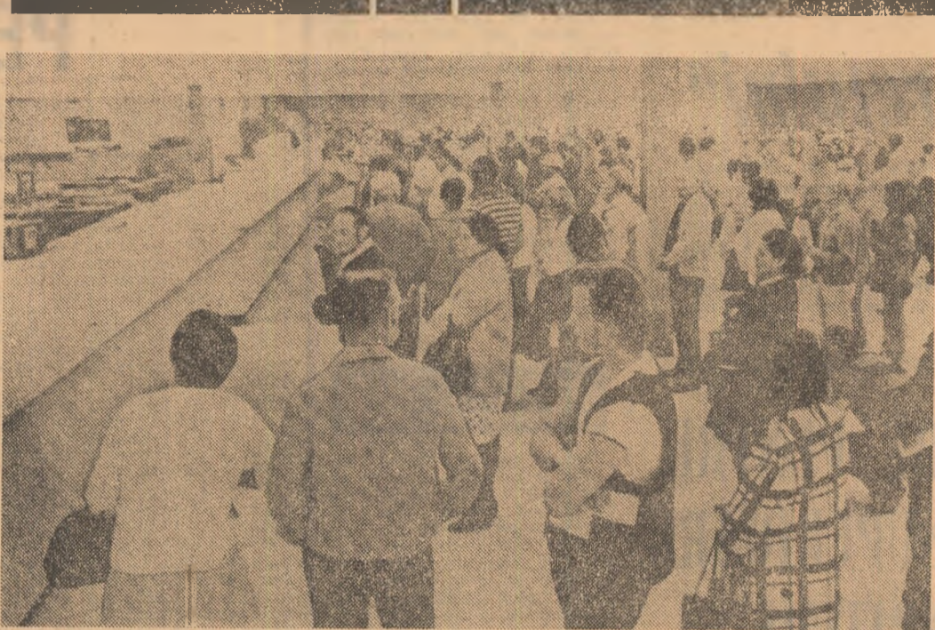
În ultimii patru ani, numărul șomerilor din S.U.A. a crescut de la 2,8 milioane la 4,8 milioane. În imagine: în așteptarea unei slujbe la un centru de plasare a brațelor de muncă într-un oraș de pe coasta de vest a Americii.