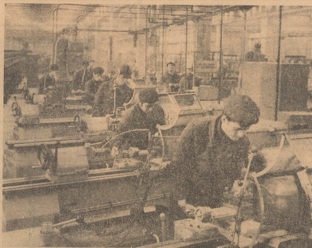
Instantaneu realizat la un nou obiectiv industrial: Fabrica de utilaje și piese de schimb din Botoșani. Ne aflăm în secția prelucrării mecanice, la linia de piese complexe. De notat: tinerii care lucrează la aceste moderne utilaje, sînt numai muncitori cu înaltă pregătire.