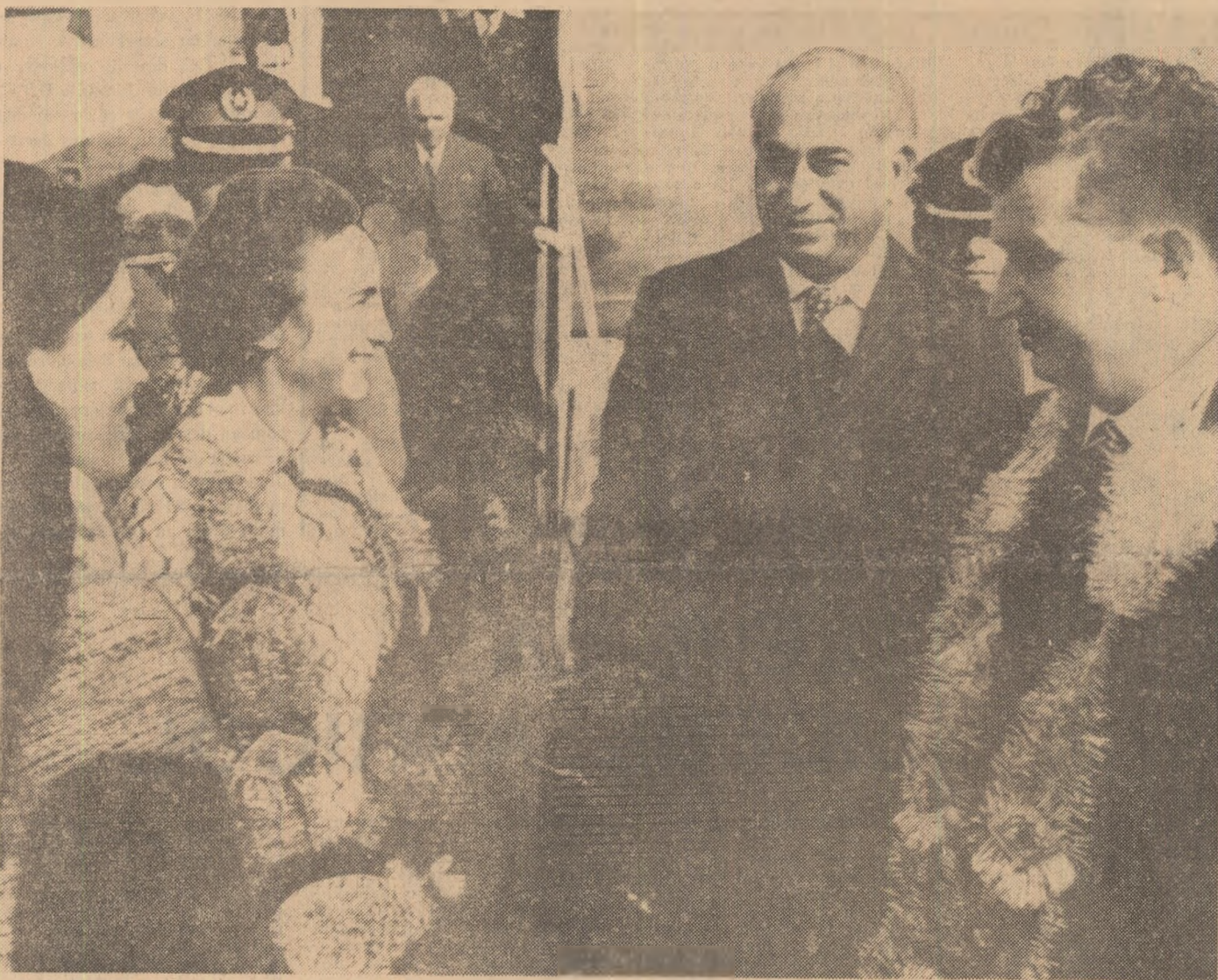
O primire sărbătorească în orașul Lahore

Convorbire între președintele NICOLAE CEAUȘESCU și președintele ZULFIKAR ALI BHUTTO