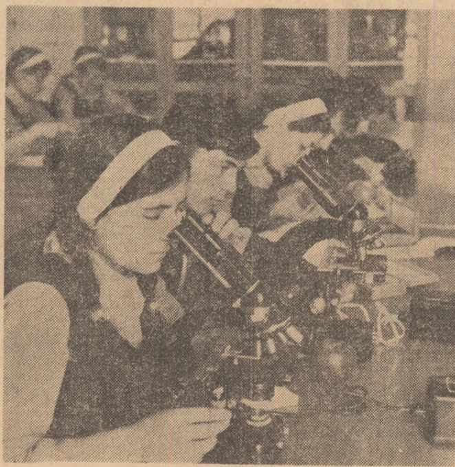
Intr-unul din laboratoarele Liceului agricol din Bîrsești

MARIETA VIDRAȘCU (Continuare în pag. a II-a)