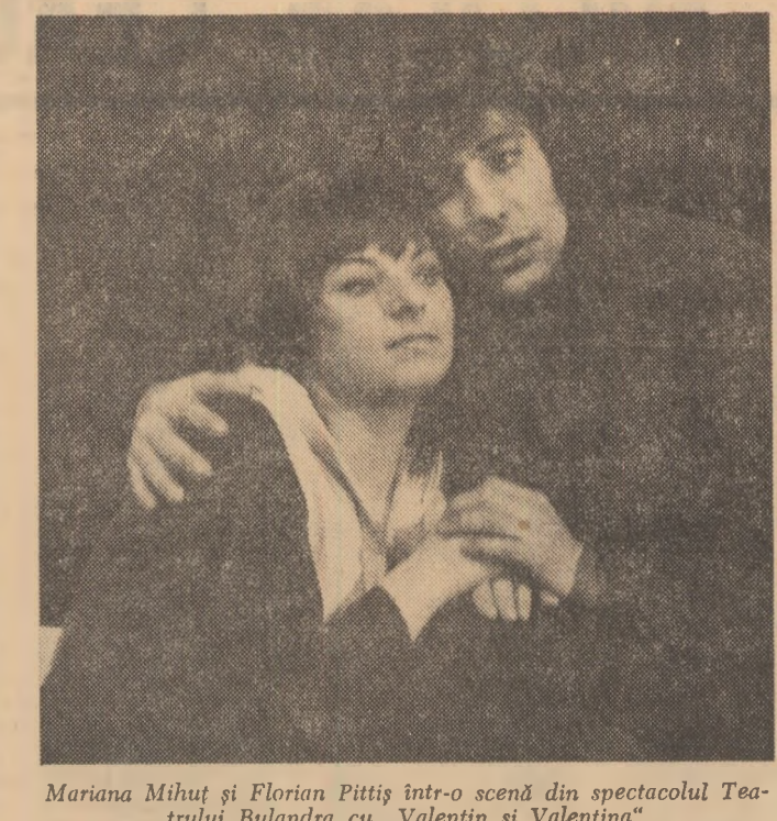
Mariana Mihut și Florian Pittis într-o scenă din spectacolul Teatrului Bulandra cu „Valentin și Valentina”