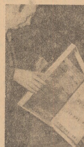
La apropiatele alegeri parlamentare din Franța vor fi folosite mașini ultramoderne de numărare a voturilor. În imagine, o ultimă verificare a acestora înaintea instalării lor