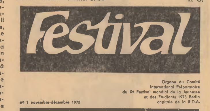
Organele Comitetului Internațional de Pregătire al Festivalului Mondial de la Jeunesse et des Etudiants 1973 Berlin capitale de la R.D.A.

N-am reîntîlnit cu o veche cunoștință: revista „Festival”. Paginile ei de format mic, bogat ilustrate, sînt un vestitor al unei manifestări tineresti ce a devenit tradițională — Festivalul Mondial al Tineretului și Studenților. La București și la Moscova, la Viena și la Helsinki, de fiecare dată cînd pregătirile pentru un nou Festival intrau în faza concretă, revista își făcea apariția. În ultimele săptămîni ale anului trecut, noua ediție a revistei a văzut lumina tiparului în capitala R.D. Germane — gazda viitorului Festival.