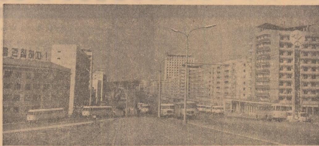
R.P.D. Coreeană: Bulevardul Cenlima din Phenian