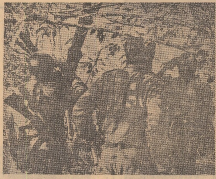
ANGOLA: Patru la forțele de eliberare angoleze în timpul unei misiuni de recunoaștere.