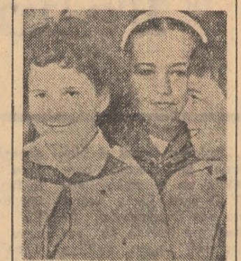
Cine nu se bucură cînd are nota 10. Instantaneu la școala generală nr. 179 din Capitală.