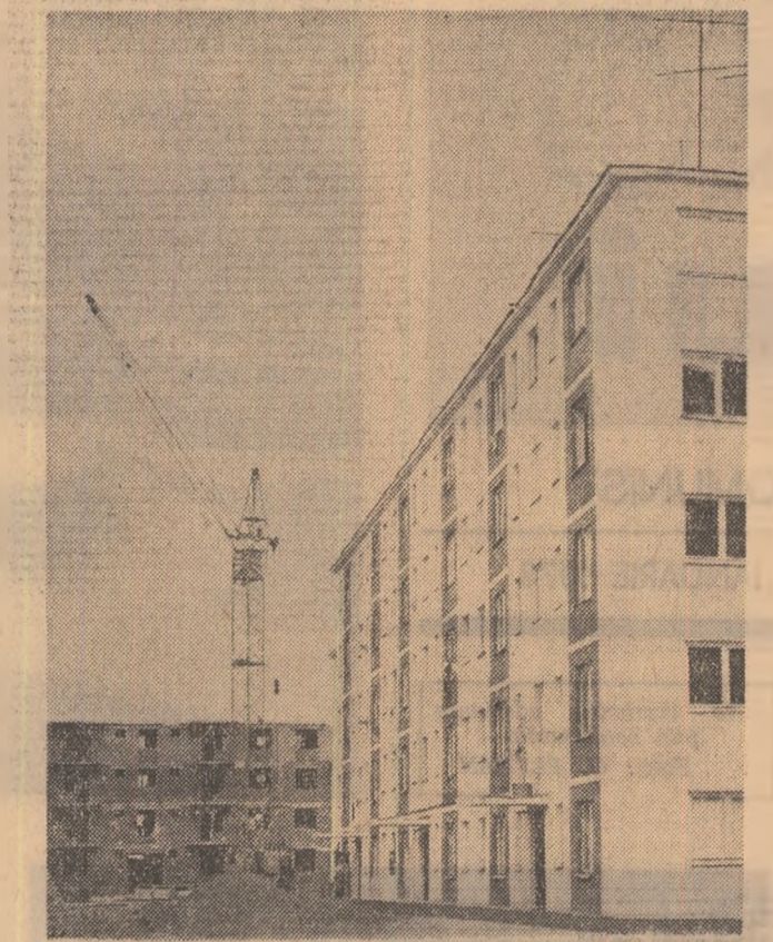
Se ridică noi blocuri la Baia Mare.