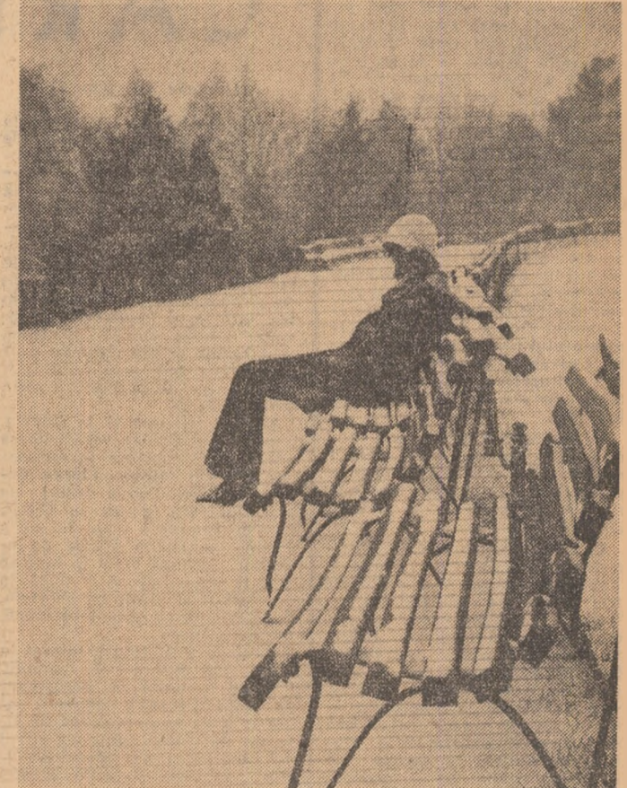
Vine sau nu vine... țarna.

liniștită. Vă rugăm mult să ne spuneți cum am putea ieși din acest „neaz”. ION DANCEA OVIDIU PAUN (Continuare în pag. a II-a)