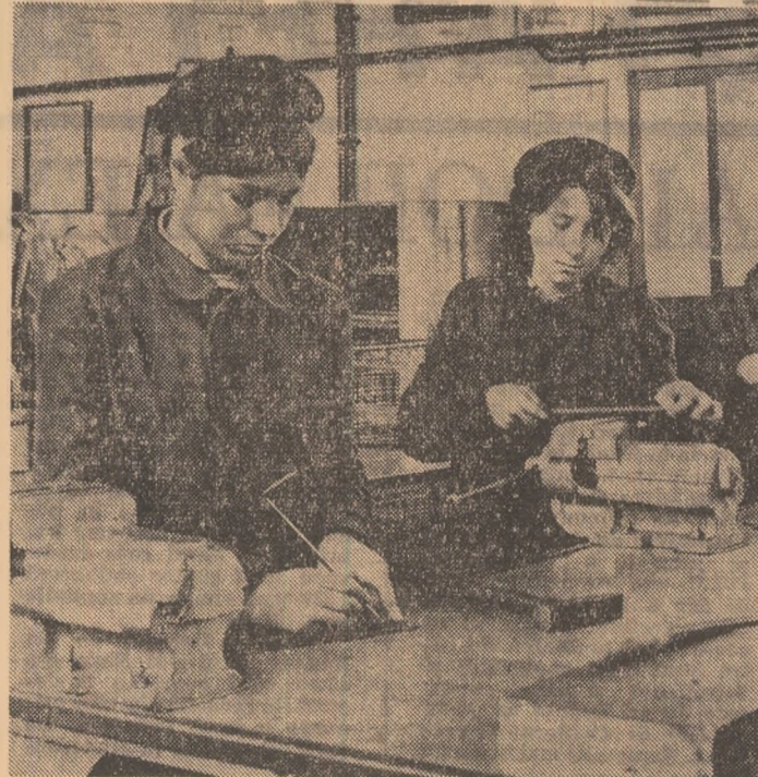
Oră practică la Liceul industrial de construcții — București.