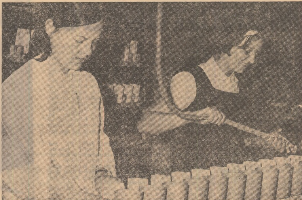
La „Faița”, întreprindere sîghisoreană, elevele Școlii generale nr. 3 au liberă trecere spre... însușirea meseriilor.