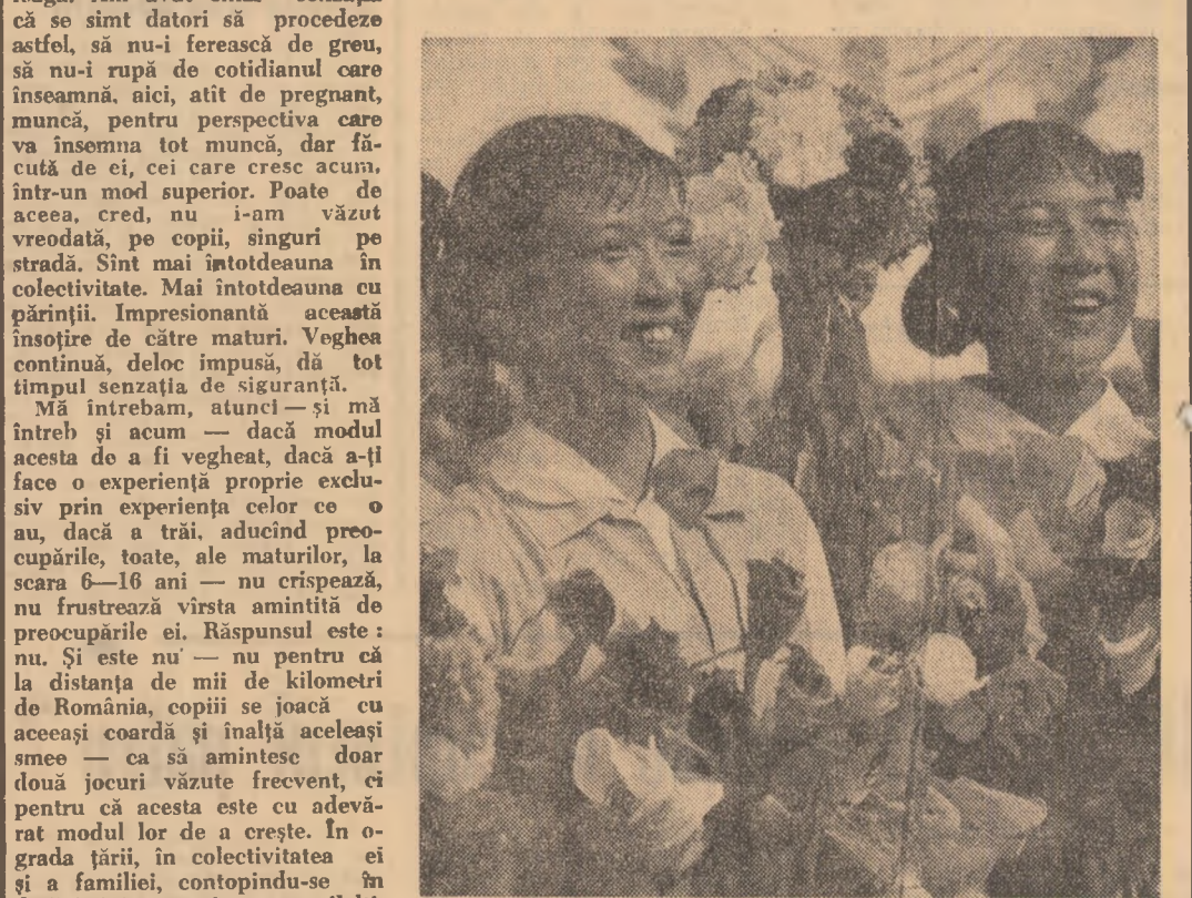
Insemnări din R.P. Chineză de LUCRETIA LUSTIG