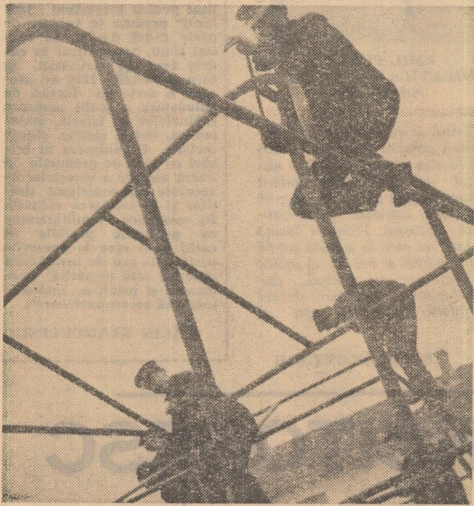
Uneori meseria se învață și așa, dovedind afilitatea și curajul înălțimilor.

gestul tinerilor muncitori care-și ajută colegii elevi. „In plus, spunea maistrul, în colaborare cu maistrul instructori, noi am încercat să subliniem absența din programa instruirii practice a cunoștințelor tehnologice pe meserii și în fiecare marș adunăm elevii să le explicăm tehnologia unui produs, operațiile, cu demonstrații practice la masa de lucru. Urmărim, de asemenea, ca fiecare elev să con-