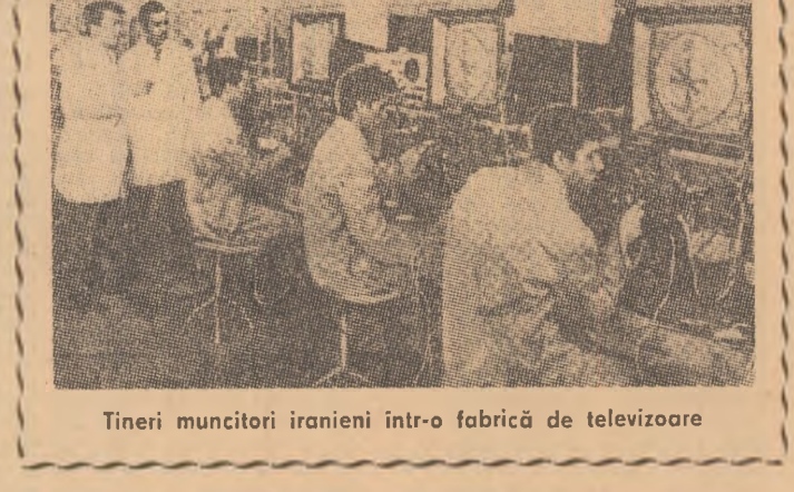
Tineri muncitori iranieni într-o fabrică de televizoare

Pe insula Vestmanna, din largul coastelor islandeze — unde vulcanul Heiðafell („Muntele sacru”) a început să erupă în noaptea de luni spre marți, după 600 de ani de inactivitate — situația s-a agravat. Riu de lavă incandescentă pornește dintr-o mare fisură — lungă de aproape două kilometri — aflată pe unul din versanții muntelui. În cursul nopții de miercuri spre joi, direcția de scurgere a lavei s-a schimbat, orientându-se spre orșutul Vestmannaeyar, situat pe malul mării, la poalele vulcanului. Evacuarea celor aproximativ 5.000 de locuitori ai orășului a fost terminată încă de marți. Cinci clădiri din orș — acum părăsite — au fost distruse de suvoiul de magmă care, în contact cu apa mării, a format de acum un nou nuntete ce s-a înălțat la peste 100 metri.