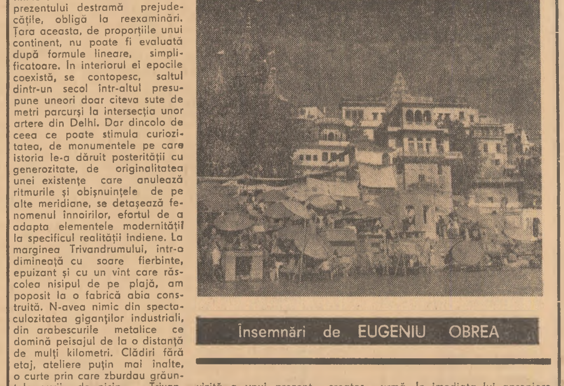
Insemnări de EUGENIU OBREA

Dar numai legendele — oricît ar fi ele de generoase — nu pot duce fericele. În India prezentul se înțelege că prosperitatea nu poate fi cîștigată pe nisipul speranțelor vage, că ea poate fi obținută doar printr-un neobosit efort care să asocieze la modul cel mai concret puterea brațelor și agetimea minții, care să aducă proiectele cutăzătoare în faza realizării. Cei ce învătă să birue masonul și încep să stăpînească energia nucleară aparțin unei Indii care, mîndră de trecutul ei, investigatează un viitor al reușitelor constructive.