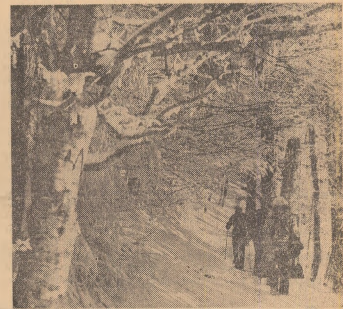
Iarnă... bogată

În legătură cu semnarea acordului privind restabilirea păcii în Vietnam, tovarășii Nicolae Ceaușescu și Ion Gheorghe Maurer au trimis tovarășilor Ton Duc Thang, Le Duan, Truong Chinh, Fam Van Dong și domnilor avocat Nguyen Huu Tho și arhitect Huynh Tan Phat două telegrame pe care le publicăm în pagina a V-a