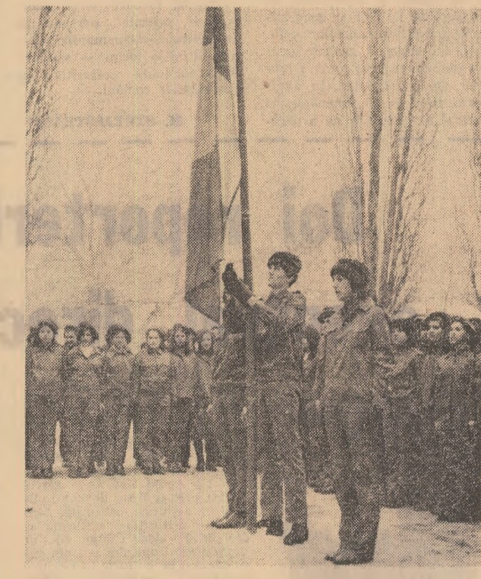
Moment solemn. Toate tinerii, toate vor poposi drapelul patriei

Legea privind organizarea apărării naționale a Republicii Socialiste România prevede ca, începînd din acest an, să participe la activitatea de pregătire a tineretului pentru apărarea patriei și elevii din clasele a IX-a și a X-a ale școlii generale, elevii din anul I și II din licee, școlii profesionale și ucenicii la locul de muncă. Pentru cei mai tineri apărători ai patriei, ziua de ieri a fost marcată de un eveniment deosebit de important — deschiderea festivă a activității de pregătire pen-