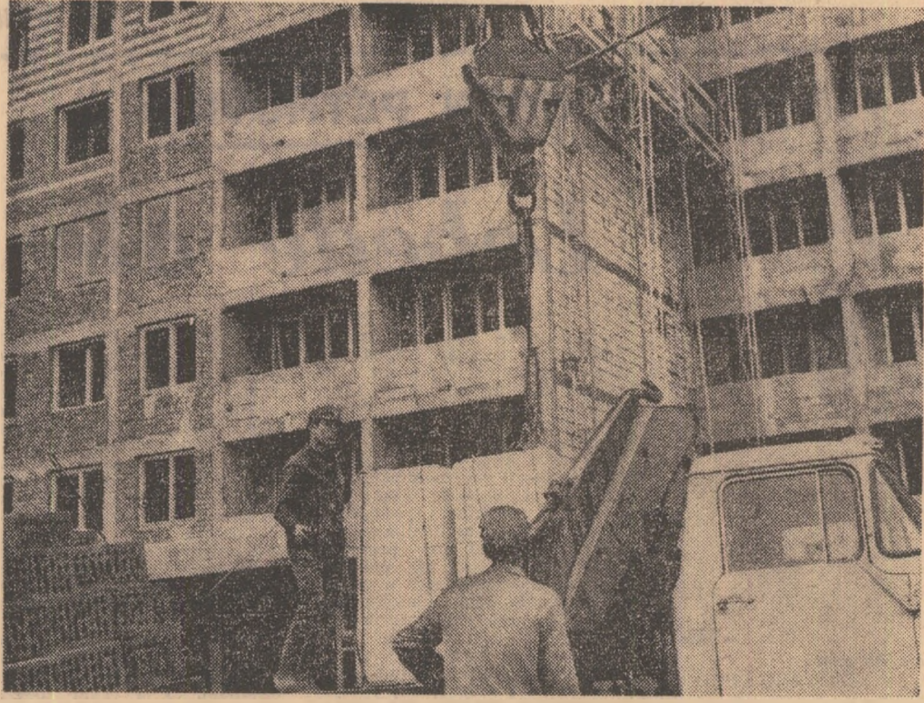
Ritmul de lucru nu depinde de vreme, ci de hotărârea oamenilor

Tineretul- factor activ în înde- plinirea cinci- nalului înainte de termen