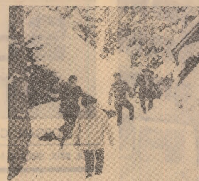
Pe potecile înzăpezite ale Buzeului