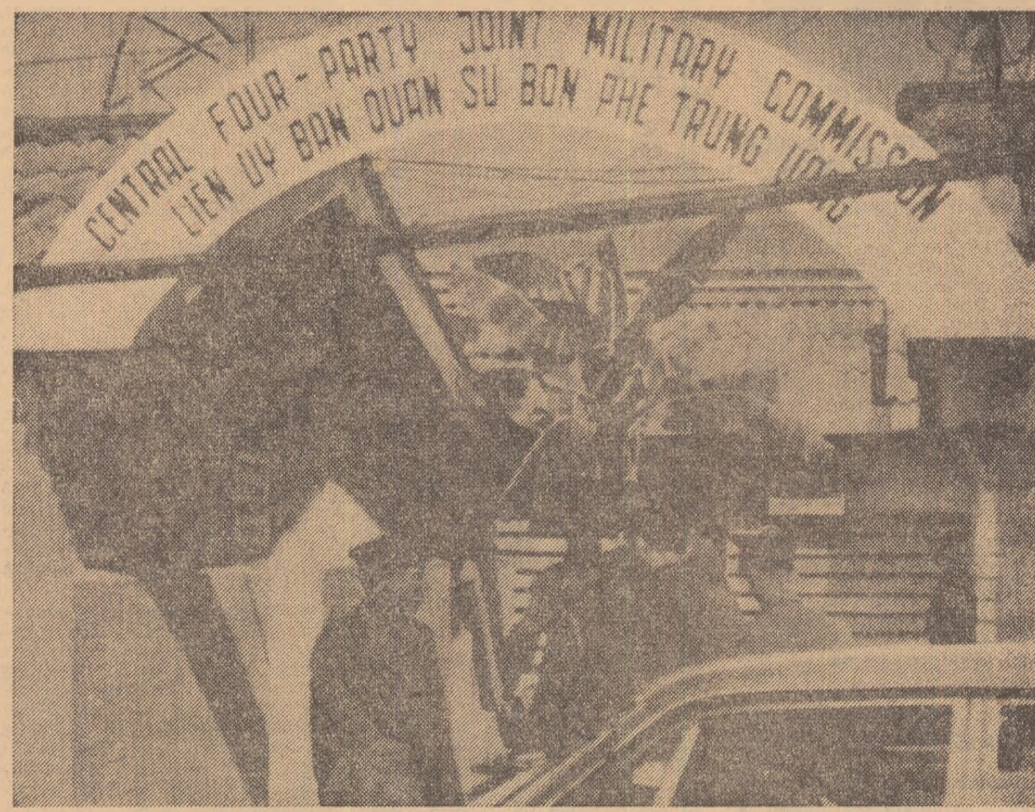
SAIGON. — Ofițer al armatei R.D. Vietnam în fața clădirii care adăpostește comisia mixtă militară evadiparită.