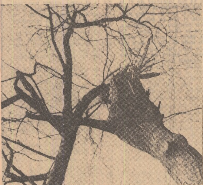
In așteptarea primăverii.

MONICA ZVIRJINSCHI (Continuare în pag. a III-a)