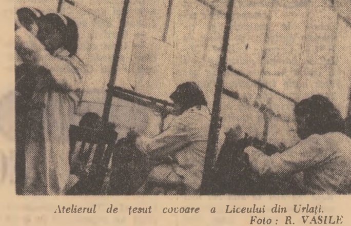
Atelierul de țesut cocoare a Liceului din Urlați.

marca vizitată presupusul castel al lui Hamlet, iar la Roma l'insomni pe celebrul pelegriin Badea Cițirău. Cel o legendă, un personaj celebru ca Munchausen, bătăiești dincolo o povestitoră cu sportivii: reporterul meditează o clipă, suride apoi ironic, pentru a deveni imediat patetic. Notățile sînt trepidante, unsoari cu valoare de secvențe cinematografice. Ar fi poate banal să afirm că noul volum tipărit de Aristide Buhoiu își impune să amlureze laturii instructive pe cea amuzantă, deseori captivantă. Călătorim în slalom pe meridiane cu un abilit povestitor — cu vocația pentru literatură dedicată copiilor — și ne simțim în egala măsură părtași cu ei la această via excursive. Pentru că dincolo de specificul vîrstei, cartea e atractivă pentru toate generațiile. Să-i repropun însă autorului asperitățile lăsate de fuga condeiului, faptul că unele momente s-ar fi convenit înca cizelate, sîfietate, stilul pe alocuri neglijent. „Slalom pe meridiane” rămîne însă o carte interesantă, ce se parcurge cu ușurință. Chiar dacă ai trecut de vîrsta copilăriei sau a adolescenței.