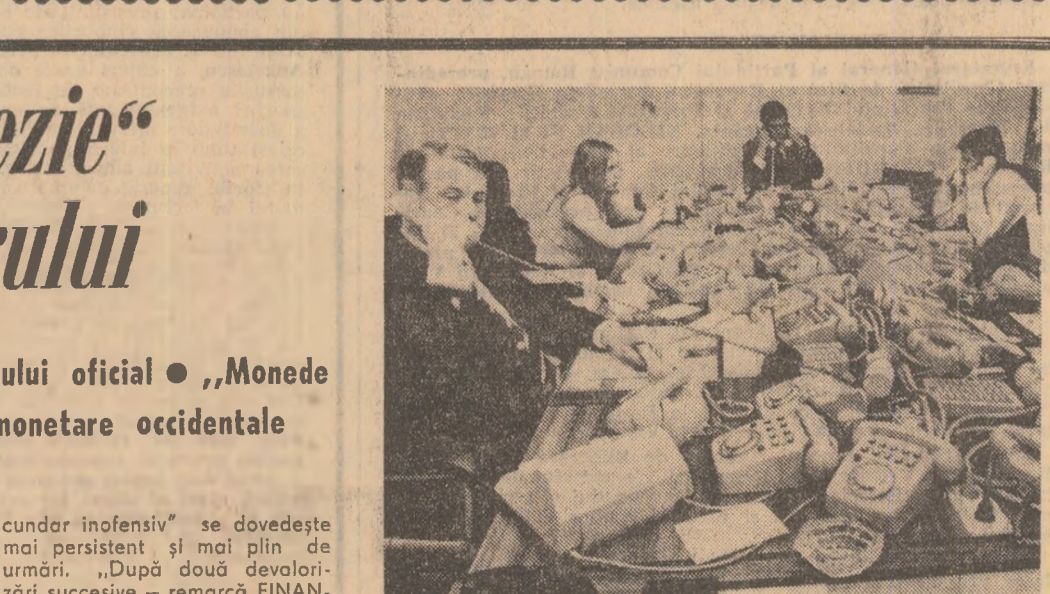
Agitație la „comandamentele” pieței aurului și deizelor: „Neîncredere în monede roase de inflație...”

Remarcînd într-o corespondență din capitala franceză că experții „celor 10” se abțin de la orice precizări și „excelează în declarații evazive” agenția FRANCE PRESSE notează: „Este, într-adevăr, greu să faci precizări de perspectivă într-un asemenea moment. Întru-niți pentru a face un bilanț al crizei monetare, experții constată că, de fapt, criza continuă și că goana nădușă după aur indică nu numai anomaliile care persistă, ci și noi probleme de rezolvat...”