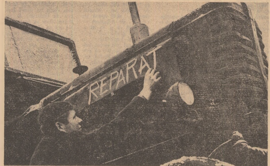
Unul din tractoarele propuse la casare și reparate la S.M.A. Dosing (județul Bihor)