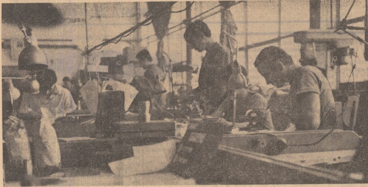
O calitate a tinerilor din secția matrișerie a Uzinei de mecanică fină București — dăruirea profesională.