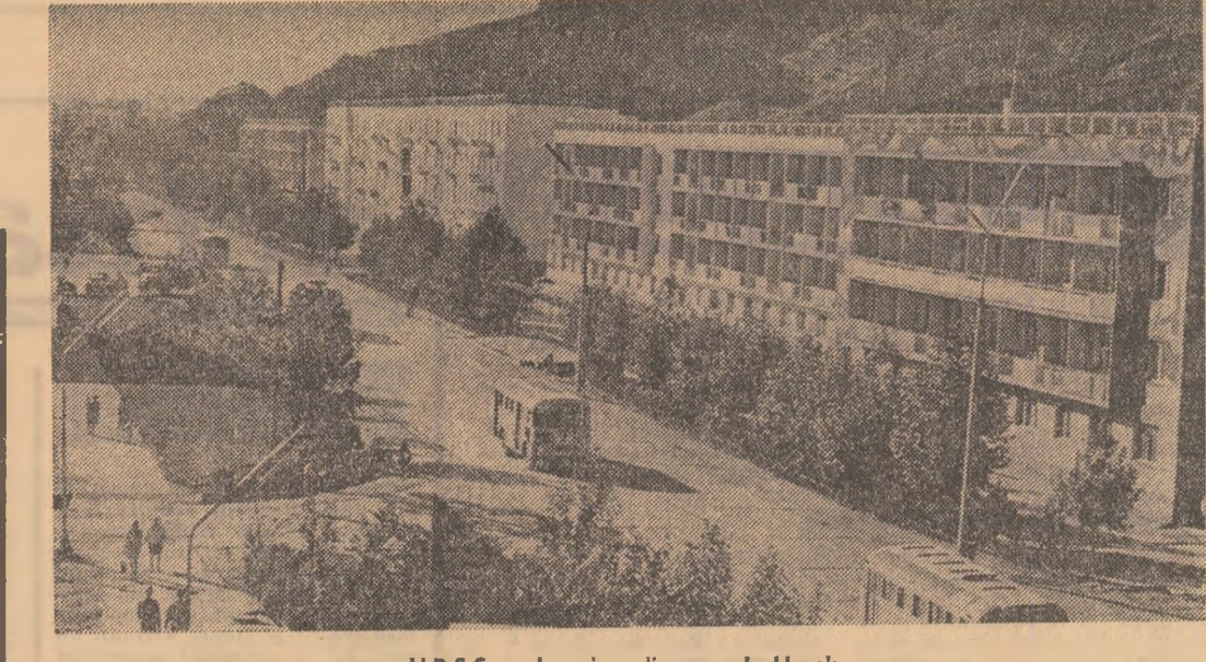
U.R.S.S. — Imagine din orașul Hurek.