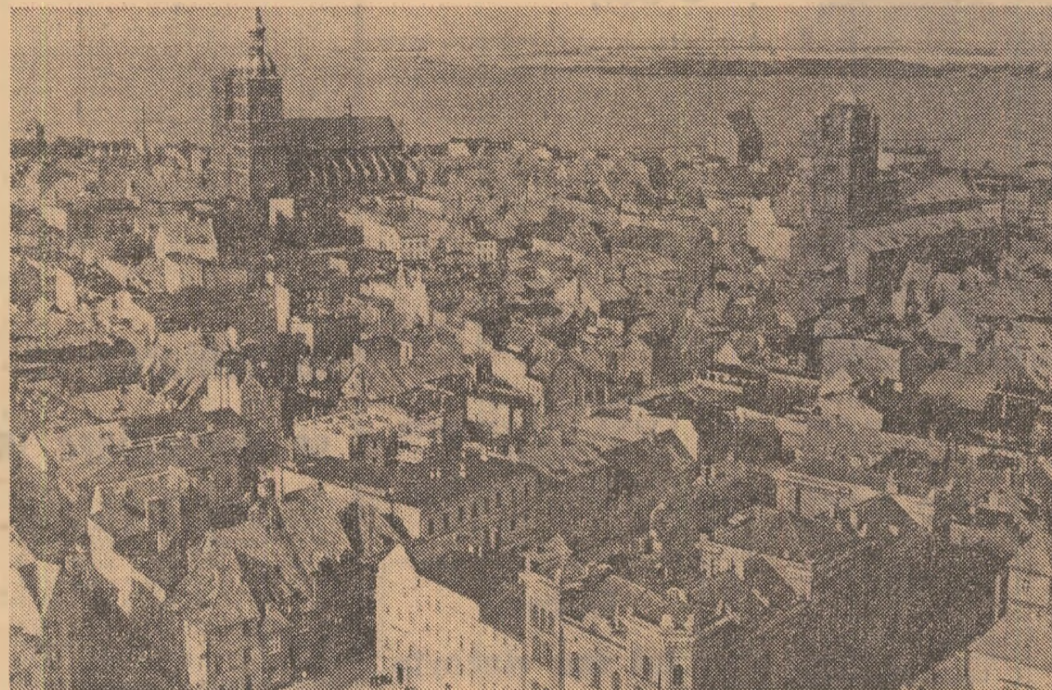
R.D.G. — Imagine din orașul Stralsund.

Începind de marți seara, în cea mai mare parte a Ungariei, a nins.