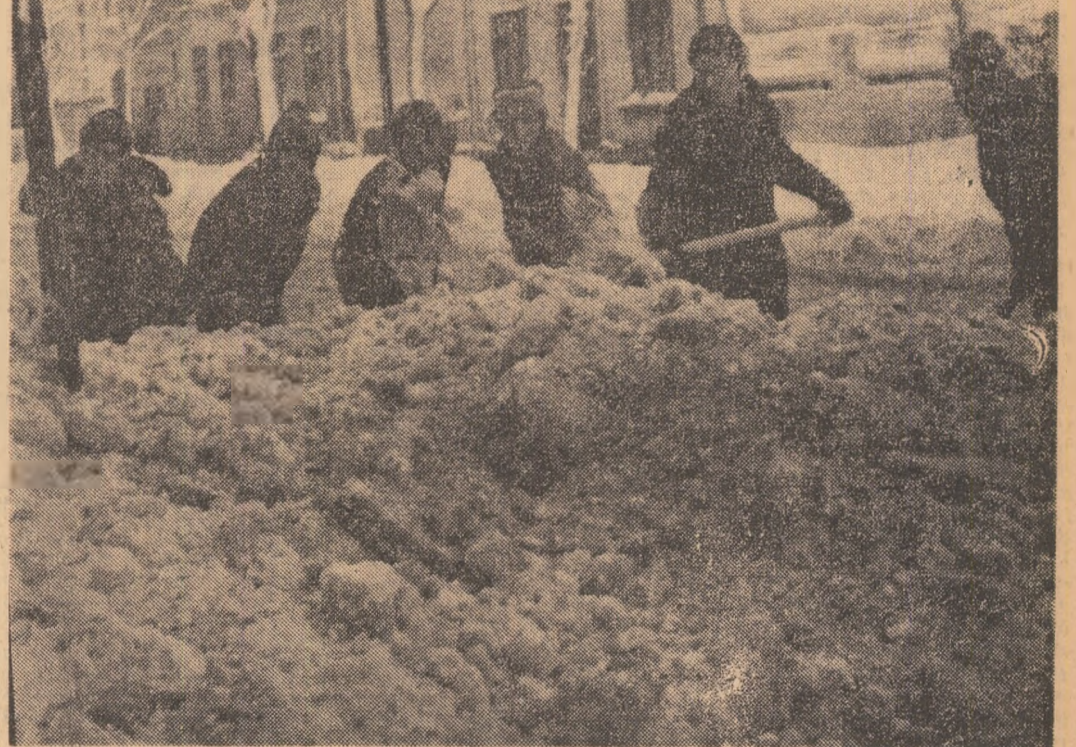
Elevii Liceului „Mihai Viteazul” lucrează la deszăpezire.