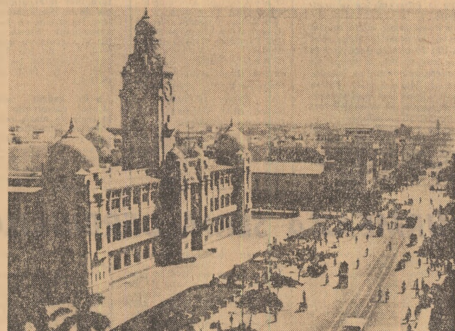
Imagine din centrul orașului Karachi.

ost naționalizate. Totodată, s-a instituit controlul statului asupra băncilor și societăților de asigurare, anihilîndu-se puterea „celor 22 mari familii” care controlau două treimi din producția industrială și peste 80 la sută din capitalul bancar al țării. Prin reforma agrară au fost improprietăți peste 3 milioane de țărani, marile proprietăți funciare fiind reduse la 150 de acri (aproximativ 60 ha) în zonele irigate și la 500 acri (200 ha) în cele neirigate. Pe plan extern, guvernul președintelui Zulfikar Ali Bhutto promovează o politică de pace și cooperare cu toate statele lumii. Deși sînt situate pe continente diferite, la mijloc de kilometri distanță, România și Pakistanul întrețin relații de prietenie și colaborare care se dezvoltă continuu. Evoluția favorabilă, ascendența a acestor relații bazate pe principiile independenței, suveranității, egalității în drepturi, neamăstării în treburile interne și avantajului reciproc a fost subliniată de nume-