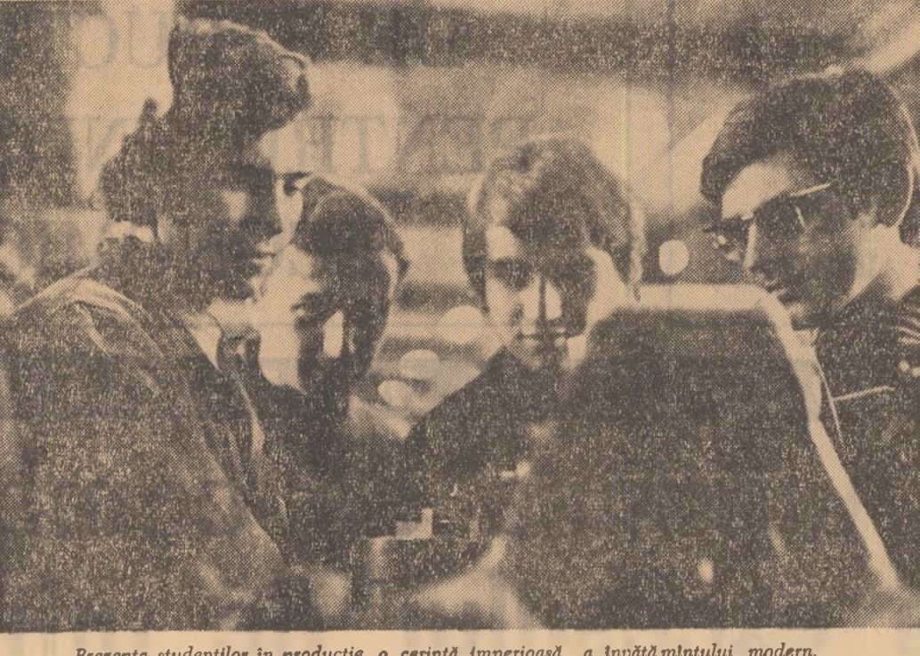
Prezența studenților în producție, o cerință imperioasă a învățămîntului modern.

ducativ. Acțiunile pe care le avem săptămînal (conferințe, întîlniri, mese rotunde, seri literare etc.) au toamă acest scop? — Colaborați cu organizația U.T.C. în această muncă? — Întreb. A încercat cineva din comitetul U.T.C. să folosească experiența dumneavoastră în acest domeniu? — Eu, ce s-a spus, mai mult cu tinerii, deci cu tinerii lui crez. Ei imi sînt cititori... Cit despre membrii comitetului U.T.C., nu li cunosc. Poate sînt printre cititori, dar în calitate asta, de membri ai comitetului nu m-au solicitat niciodată. Și cred că i-aș putea ajuta; în anul de cînd lucrez aici am ajuns să știu unele lucruri despre preferințele tinerilor, mi-am format și unele relații utile tinerii oamenilor de cultură și orășului, așa că multe acțiuni interesante s-ar putea organiza dacă comitetul U.T.C. s-ar gîndi la o astfel de colaborare... — Militarii din rîndul portului m-au solicitat să organizăm o expunere asupra istoricului, a