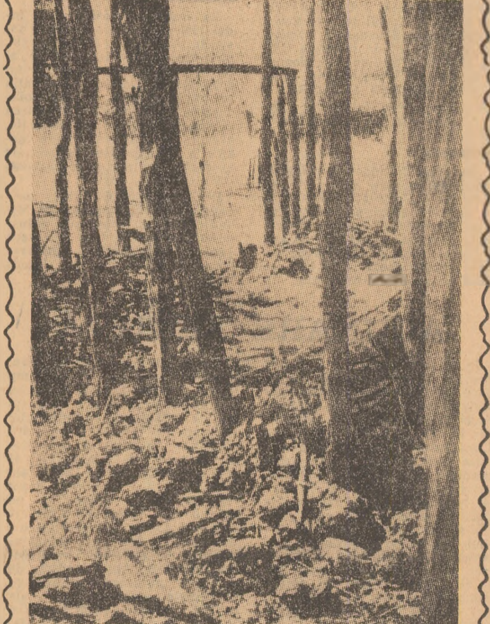
O așezare pașnică din zona eliberată transformată în ruine de aviația portugheză. Bombele nu pot însă, intimidă pe eroicii luptători ai P.A.I.G.C.

toriu. Știrile transmise, în ultimul timp, de telecurile agențiilor de presă confirmă că în Guineea-Bissau și Insulele Capului Verde, forțele portugheze au continuat să slăbească. Forțele de eliberare lansează atacuri viguroase și își extind controlul asupra unor noi zone. Potrivit unui comunicat difuzat de la Dakar de P.A.I.G.C., la începutul acestei luni, unitățile patriotice au supus unui susținut tir de artilerie principalul centru urban din sudul Guineei-Bissau — orașul Catio, provincin trupelor portugheze importante pierderi în oameni și materiale. Lupte violente au fost declanșate în sudul țării, în apropierea taberei