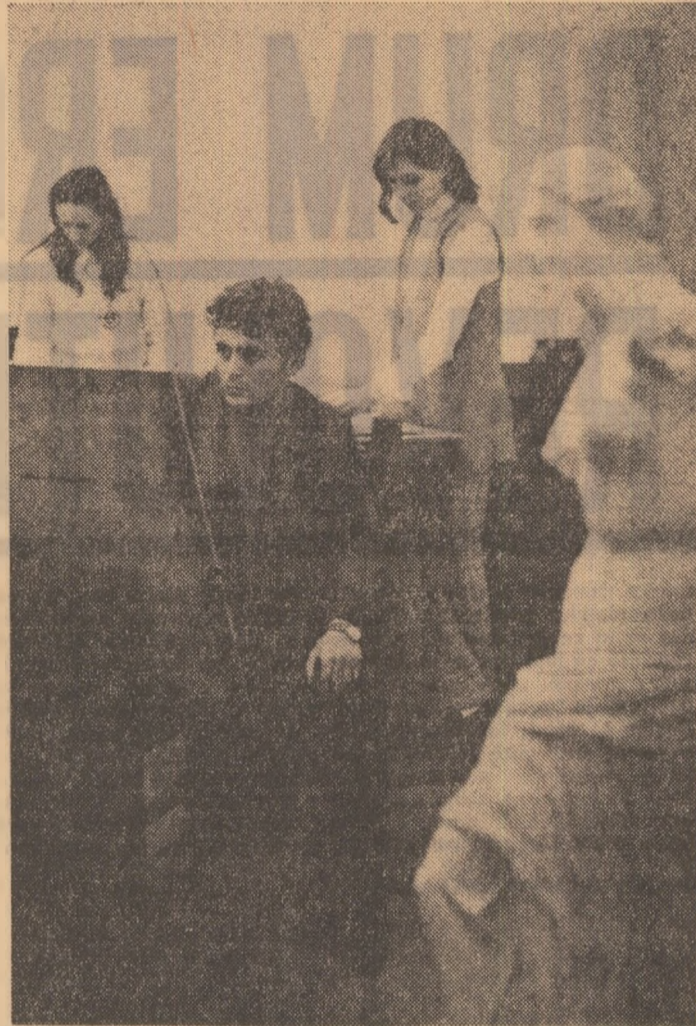
Clasa de grafică la Școala populară de artă din Oradea.