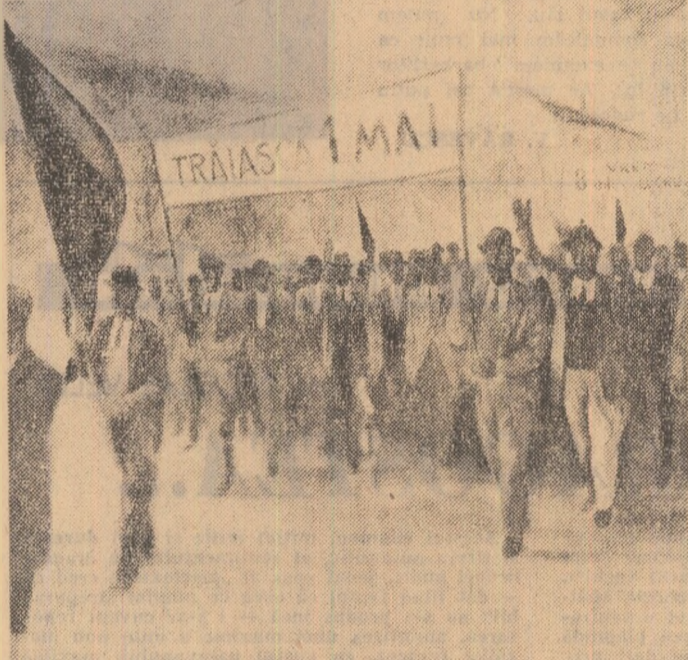
Prima demonstrație a zilei de „1 Mai” din România. Acuarela de Iejiude — 1890.

(I.H. FICSINESCU despre „Rațiunea de a fi a socialismului în România”).