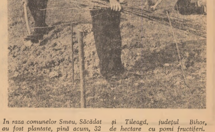
În raza comunelor Smeu, Săcădat și Tileagdă, județul Bihor, au fost plantate, pînă acum, 32 de hectare cu pomi fructiferi.

„Fiecare tânăr să sădească cel puțin un pom”, acesta este genericul cu care se desfășoară tradiționala Săptămână a primăverii. În cadrul acestei entuziaste acțiuni, aproape 2 milioane de purtători ai cravatorilor roșii, din întreaga țară, plantează puieții de arbori și arbuști, flori și plante ornamentale. Astfel, din inițiativa Comandamentului orășnesc al pionierilor, Orșova a fost declarat „Orașul florilor — 1973”, urmând ca aici să fie sădite cele mai frumoase specii de flori.