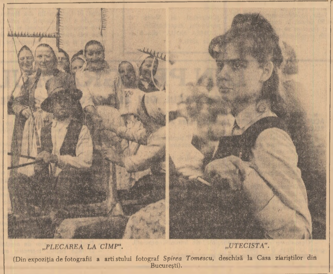
„PLECAREA LA CIMP”

Firește că-i poate satisface această delectare, dar repet cele spuse mai sus, dragostea („prieteniță”) are dinamica, traectoria ei particulară. Și oricum, dacă dragoste cu sila nu se poate face, nici un atasmament sentimental cu mila nu văd să aibe mari șanse de izbândă.