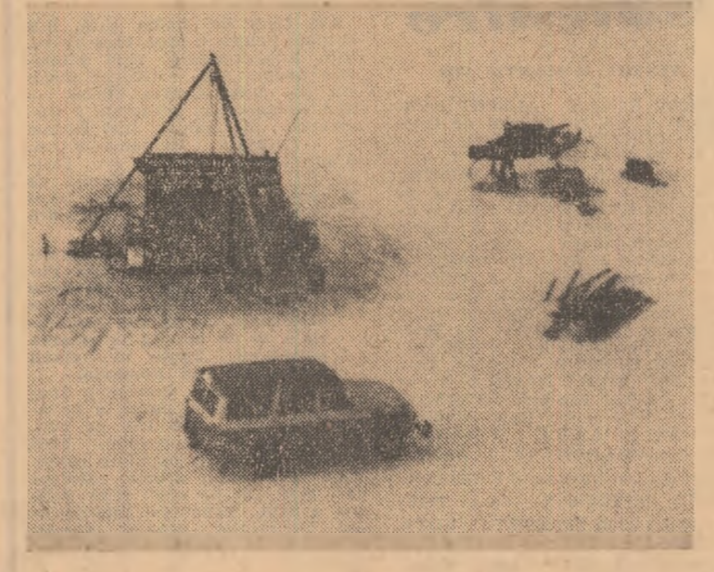
FINLANDIA : La Oraivainen, pe coasta de vest a Finlandei, se fac cercetări subacvatice, la adîncimi de peste 300 de metri pentru găsirea unor zăcăminte de nichel.

Președintele Comisiei pentru probleme externe a Senatului S.U.A., William Fulbright, a declarat că, o dată cu retragerea trupelor americane din Vietnam, nu mai este posibilă nici o justificare pentru continuarea bombardamentelor aviației americane în Cambodgia. El și-a exprimat neliniștea pentru continuarea raidurilor avioanelor americane și implicarea Statelor Unite în războiul din Cambodgia.