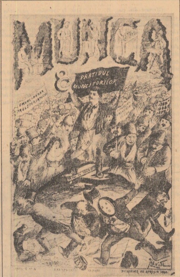
„Munca” — organul central de presă al partidului muncitorilor — 1890—1894.

Pentru Consiliul Național, unul din secretari J. GUESDE