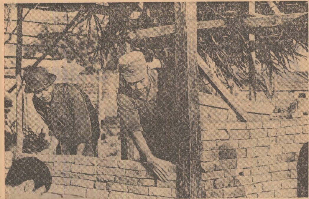
R.D. VIETNAM : La Hanoi se lucrează intens la reconstrucția clădirilor avariate în timpul războiului.