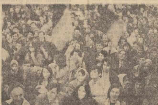
Un entuziasm prea mare, pentru o sală... atât de mică.