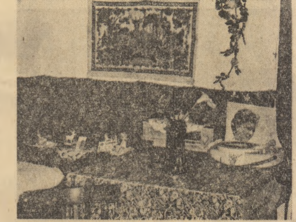
În lipsa locurilor, obiectivul amintit al unei din camere unde...