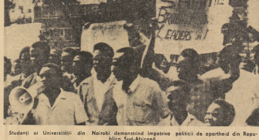
Studentii ai Universității din Nairobi demonstrând împotriva politicii de apartheid din Republica Sud-Africană.

În continuare, declarația arată că Statele Unite au încălcat prevederile acordului de la Paris, prin aceea că, retrăgându-și trupele din Vietnamul de sud, au lăsat să-și continue activitățile militare, precum și un număr de personal militar, rămas sub titulatura de consilieri civili.