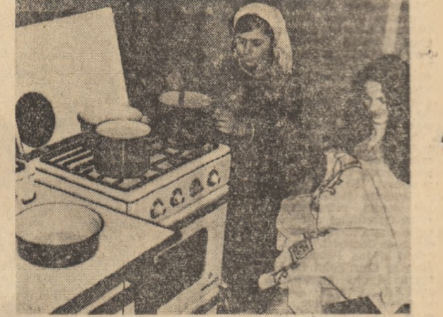
Fiecare filatoare este o gospodină. Și fiecare din ea este prețioasă...