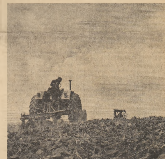
Paralel cu semănatul culturilor din prima urgență, mecanizatorii ce deservesc cooperativa agricolă Suplacul de Bărcău, execută arături pe suprafețele nelucrate în toamnă.