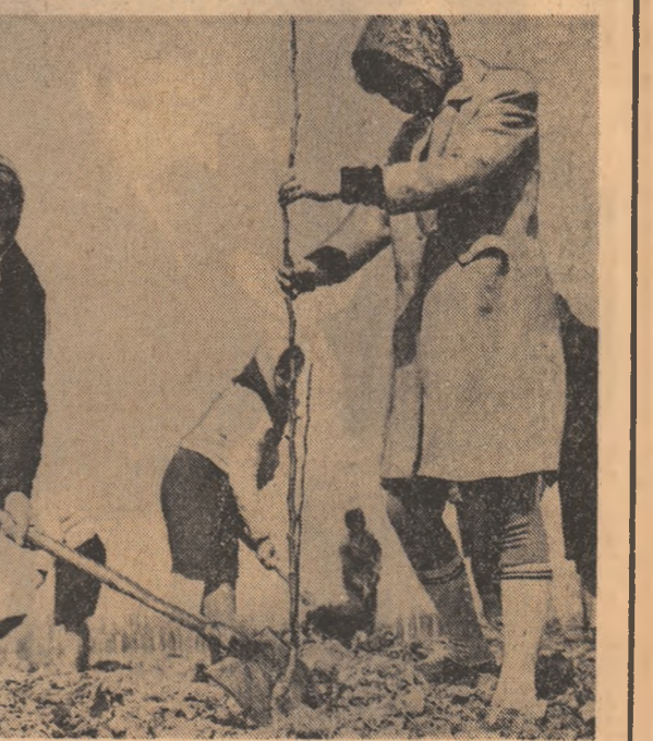
La cooperativa agricolă de producție din Lipănești, județul Argeș, tinerii au plantat cu pomi fructiferi peste zece hectare.

In județul Suceava, peste 10.000 de tineri au participat la acțiunile de sădire a pomilor fructiferi și a arborilor ornamentali. În renumitul bazar pomicol al Fălticeniilor, în zona Rădășeniilor și la fermele pomicole din Pretești și Vulturești, peste 2000 de tineri au efectuat lucrări de îngrijire și curățare a acestor întinse livezi. La Fălticeni, în „Dumbrava Minunată”, uteciștii au desfășurat ultimele acțiuni de îngrijire și sădire a arborilor ornamentali în vederea deschiderii unei frumoase cabane pe care nici un cititor pasionat al lui Sadoveanu, nu o va putea ocîli. Suprafața pe care s-au desfășurat pînă în prezent acțiunile de muncă patriotică depășește 300 ha. ALEXANDRU AMĂRIUCAI