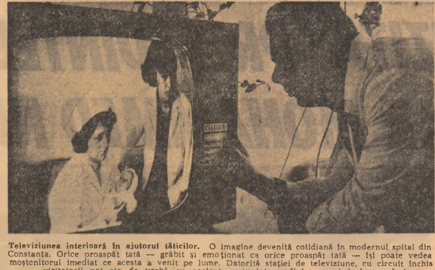
Televiziunea interioară în ajutorul tăticilor. O imagine devine cotidiană în modernul spital din Constanța. Orice proaspăt tată — grăbit și emoționat ca orice proaspăt tată — își poate vedea moștenitorul imediat ce acesta a venit pe lume. Datorită stației de televiziune, cu circuit închis vizitatorii pot sta de vorbă cu pacienta prin intermediul camerei de luat vederi.