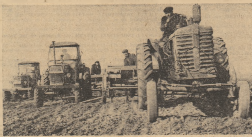
La cooperativa agricolă din Vădăstra, toate semănăturile funcționează din plin pe suprafețele rezervate culturilor din prima urgență.