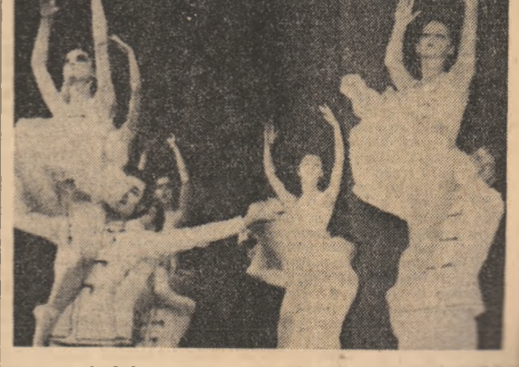
Un grup de balerini care au evoluat în cadrul Festivalului republican al liceelor de coregrafie-CI. Citiți în pag. a III-a Laureatii Festivalului culturo-educativ elevilor din școlile și liceele de artă.