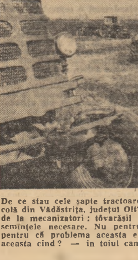
De ce stau cele sapte tractoare din Vădăștița, județul Olt? Răspunsul l-am primit chiar de la mecanizatori...