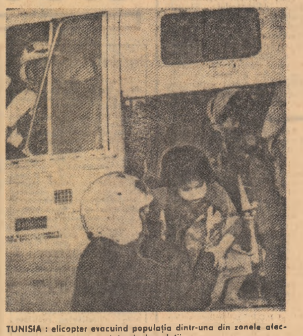
TUNISIA: elicopter evacuând populația dintr-una din zonele afectate de inundații.