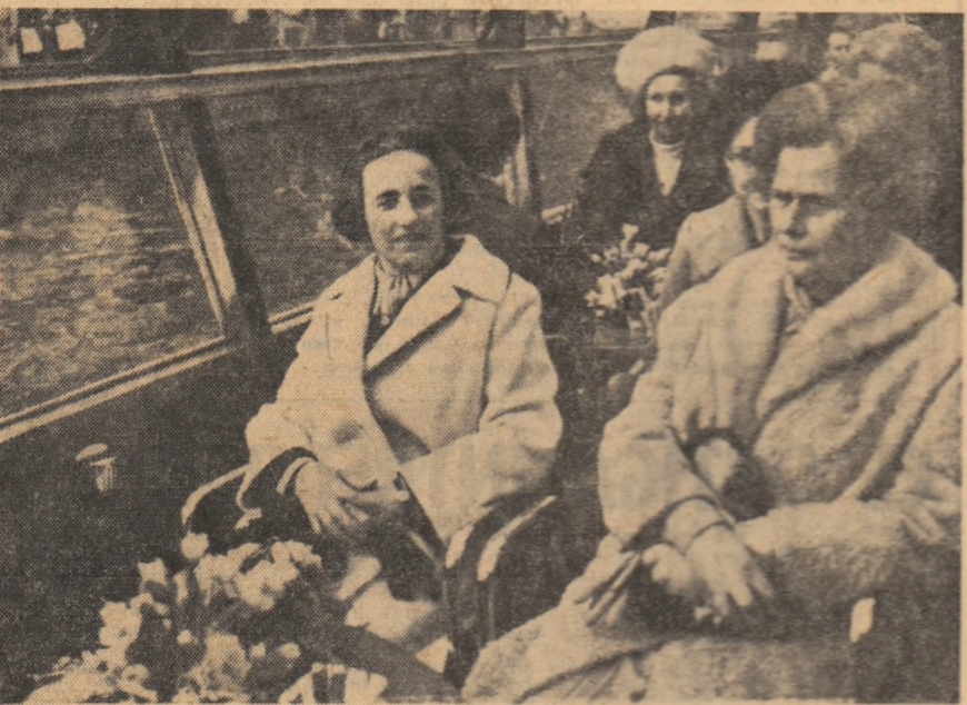
Într-o ambarcațiune de promenadă sînt vizitate frumusețile Amsterdamului

În cursul după-amiezii de marți, tovarășii Elena Ceaușescu, însoțită de Alteța Sa Regală prințesa Beatrix a Olandei, a vizitat, într-o ambarcațiune de promenadă, pitorești canale ale Amsterdamului. Vizita a oferit prilejul cu-