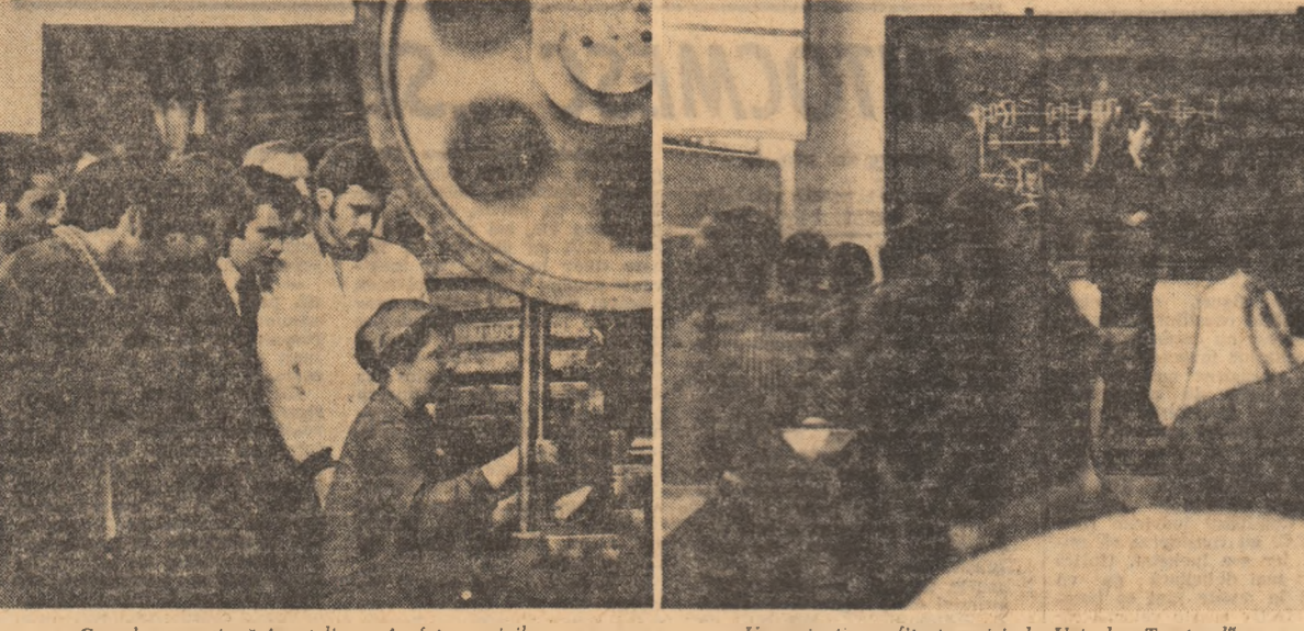
Cursul se continuă în atelier, în fața mașinilor.