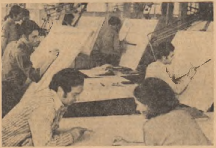
În această sală de proiecte din uzină, proiectanții sînt studenții.

O prezentare amplă a experienței brașovene privind integrarea învățămîntului cu producția în ancheta noastră din PAGINA A IV-A