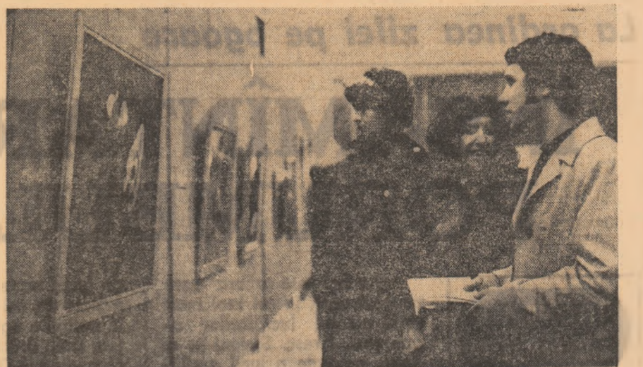
La expoziția de artă românească contemporană deschisă la clubul uzinelor „Republica”.

poziții, ca ele să aibă un program precis, să fie un fel de capole ale unor lecții vii de pictură. În acest mod ne putem completa o serie de lacune, as zice elementare, din formația noastră în primul rînd ca intelectuală, și în al doilea rînd ca ingineri”. „Să nu ne speriem de lipsa, într-un fel de așteptat, mărturisirii Cristiana Dănescu, anul II Instalații, a informării noastre în privința artei. S-a spus că viziunea unei expoziții de artă presupune o anumită cultură. Eu cred că mai presupune și o anumite sensibilitate, o anumită receptivitate. Poate că nu am surprins acum, la început, cele mai nuanțate intenții ale artiștilor. Le-am admirat lucrările ca pe un lucru frumos, izvoit dintr-o nobilă pasiune. Întîlnirea directă a discutiile neprotocolare cu artiștii ne-au ajutat să înțelegem multe lucruri privind pictura. Accentuăm că aceste întîlniri directe sînt tot atât de bine venite ca și expunerea propriuzisă a operelor, cel puțin într-o