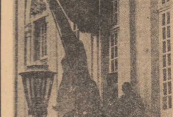
În ziua în care seful administrației saigoneze Thieu vizita Bonn, un grup de tineri au arborat la primăria capitalei R.F. Germania steagul Guvernului Revoluționar Provizoriu al Republicii Vietnamului de Sud.