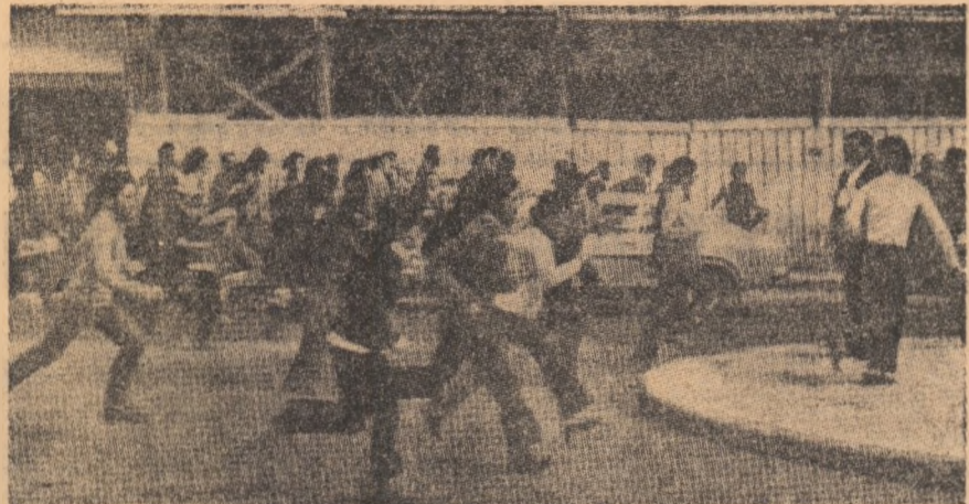
PORTUGALIA: tineri participanți la o demonstrație de protest la Aveiro, atacați de poliție.