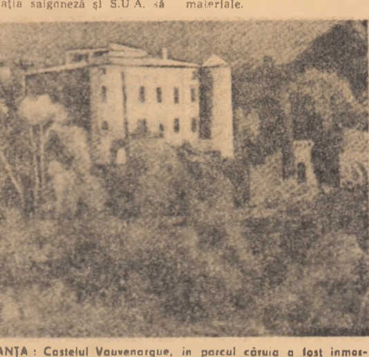
FRANȚA: Castelul Vauvenargues, în parcul căruia a fost înmormîntat Pablo Picasso.