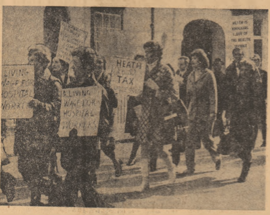
ANGLIA: Demonstrație a cadrelor sanitare din Dover împotriva politicii guvernului de înghețare a salenilor.