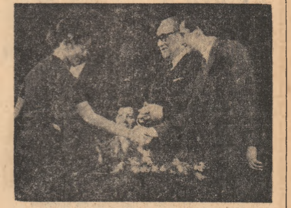
În timpul festivității de decernare a premiilor.