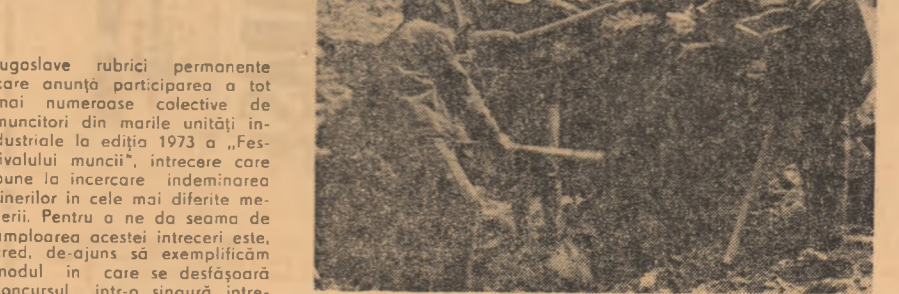
Tineri iugoslavi la muncă patriotică.

În intervențiile lor, reprezentanții Japoniei și Suediei au prezentat documente de lucru cu caracter tehnic, privitoare la două dintre subiectele dezbătute în detaliu la prezenta rundă de negocieri.