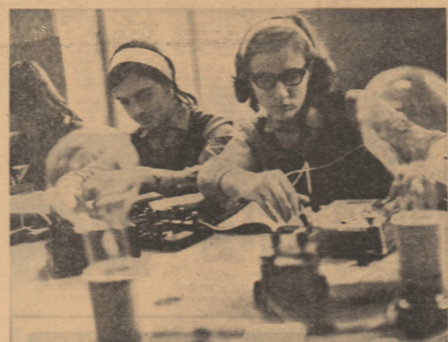
Lucrătorii din fabrica Dacia 1300 sunt foarte activi în realizarea planului de producție.

Pe lângă Dacia 1300, se fabrică și alte modele de mașini. În prezent se lucrează la dezvoltarea unui model de 1.6 litri, care va fi produs în anul 1974. În prezent se lucrează la dezvoltarea unui model de 1.6 litri, care va fi produs în anul 1974.