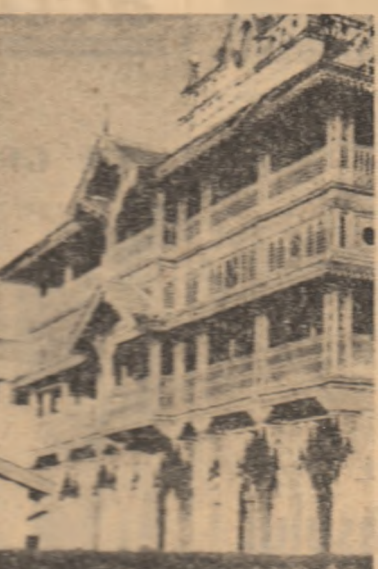
Formarea statului: stat a avut o importanță deosebită pentru coniugarea eforturilor în vederea lichidării gravelor consecințe ale îndelungatei dominații străine, pentru propășirea economică și socială. Potrivit programului politic și economic definit în cunoscuta „Declarație de la Arusha“, care a fixat strategia dezvoltării Tanzaniei, au fost naționalizate principalele mijloace de producție, o serie de companii străine, plantații de sistăți întreprinderi de comerț exterior etc. Actualul plan cincinal (1969-1974) prevede realizarea a 285 noi obiective industriale, care vor valorifica într-un grad mai înalt resursele țării. În acest sens, 34 la sută din totalul investițiilor sunt afectate industriei. Agricultură, care ocupă 90 la sută din populația Tanzaniei, se bucură de o mare atenție. Aproape un milion de țărani s-au grupat în sate cooperativizate de tip „ujamaa“ (înfrățire) și folosind în comun mijloacele deosebite de stiel, desțeleneșterea, amenajarea sistemelor locale de irigații, clădirea așezărilor social-culturale grupuri.

Poporul Tanzaniei sărbătorește astăzi ziua sa națională. Cu două ani în urmă, la 26 aprilie 1964, Tangania și Zanzibarul (unități de 1609 km p. de ocean) lădau dinlăuntru curii voinei: maselor populare, s-au unit într-un singur stat — Republica Unită Tanzania.