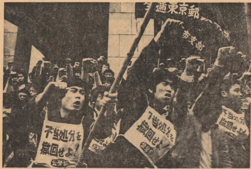
JAPONIA: Aproximativ 3 500 000 de oameni ai muncii din capitala niponă au participat la o puternică acțiune organizată în cadrul așa numitei „ofensive de primăvară“, revendicând îmbunătățirea condițiilor de muncă și viață.