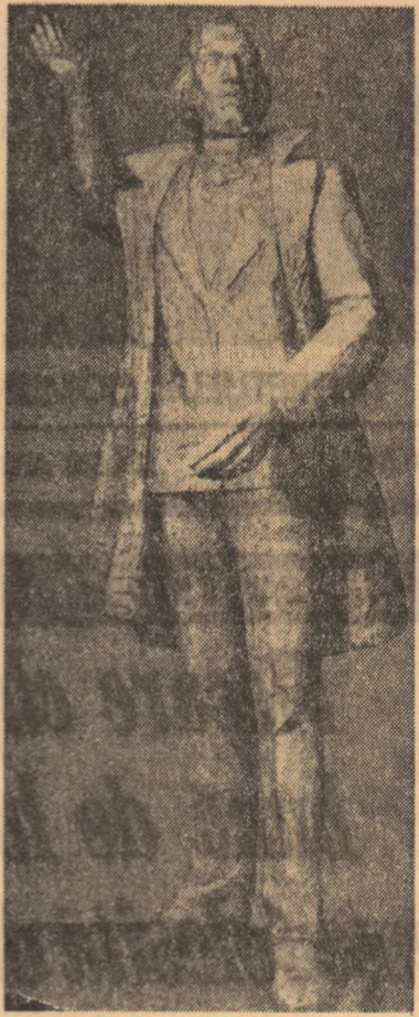
"NICOLAE BĂLCESCU" — sculptură.