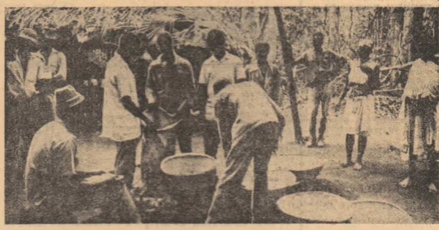
În regiunile eliberate din Guinea-Bissau se strînge recolta obținută prin munca colectivă.