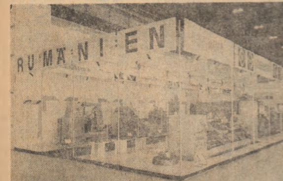
Lepzig — mașinile-unelte din standul Intreprinderii „Mașinesport” au întrunit aprecierile unanime ale specialiștilor și vizitatorilor