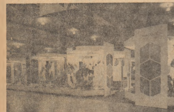
Articolele industriale ușoare românești, expuse anul trecut la Toronto, în Canada, au încântat privirile experților prin eleganță, culoare și varietate inspirată a țesăturilor și confecțiilor.

Președintele în lumen tină generație se manifesta ca o importantă forță socială și politică, cerându-și dreptul de a-și spune cuvântul în problemele esențiale ale prezentului. Aproape că nu există zi în care agențiile de presă să nu transmită știri despre situația în care se află tineretul dintr-o țară sau alta, despre acțiunile întreprinse de tineri în sprijinul revendicărilor lor economice, sociale sau politice. Căci, dacă societatea socialistă a asigurat tinerii generații cadrul optim pentru a participa din plin, în mod activ și creator, la întreaga viață economică, socială și politică a statului, în țările dominată de puterea capitalului această rămâne încă un deziderat pentru realizarea căruia tineretul trebuie să desfășoare o luptă continuă și asidua.