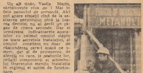
„De mine depinde bunul mers al întregii instalații”

Pentru oamenii care stăpânesc complicatele instalații de la Combinatul petrochimic Brazi, ziua de 1 Mai, la fel ca orice altă sârbătoare, este și obișnuită în lucru. Alții doar că e considerată ceva mai grea decât celelalte. Mai grea nu pentru că acum familiile și prietenii lor au zi liberă, ci pentru că în astfel de zile se întăresc su-