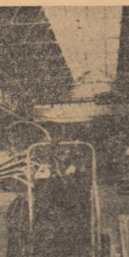
Peste 25.000 de oameni ai muncii au participat la greva declanșată de Uniunea sindicatelor daneze din diverse ramuri economice ca răspuns la refuzul patronatului de a include în contractele colective de muncă pe viitorii doi ani revendicările lor. În fotografie: o secție a fabricii de ciment „F.L. Smith” din Copenhaga, pustie în timpul grevei.

În tribuna oficială s-au aflat Tudor Iljov, prim-secretar al C.C. al P.C. Bulgar, președintele Consiliului de Stat, alți con- ducători de partid și de stat, perso- nalități ale vieții publice bul- gare, reprezentanți ai misiunii diplomatice, oaspeți de peste hotare invitați la Sofia, printre care și o delegație a Uniunii Generale a Sindicatelor din România.