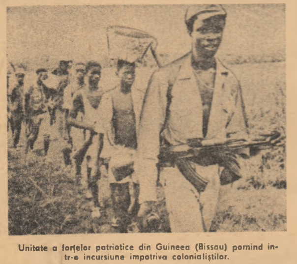
Unitate a forțelor patriotice din Guinea (Bissau) pominînd în- tr-o incursiune împotriva colonialiștilor.

mercenari. Sekou Toure a de- clarat că poporul Guineei este hotărît să dea toate manevrele forțelor imperialeiste și să dea o răspuns energic oricăror acțiuni provocatoare. CONGRESUL S.U.A. A APROBAT PRELUNGIREA PE ÎNCA UN AN A ÎMPUNERILOR prezidențiale în domeniul controlului prețurilor și salariilor, conferită pentru prima dată în 1970. În virtutea ac- tei legi, președintele S.U.A. poate adopta orice hotărîre în politica privind prețurile, sa- lariile, taxele, chiriile și impo- zitele, inclusiv dreptul de a dispune înghețarea lor. Hotărî- rea forului legislativ a fost a- doptată doar cu 6 ore înainte ca vechea lege în materie să expire.