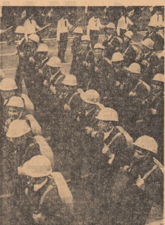
In rînduri compacte, într-o aliniere perfectă, trec tinerii care poartă simbolicele semne vestimentare ale constructorilor socialismului.

Întreaga asistență politică și morală acordată de partid, pentru Comitetul său Central, pentru secretarul său general, tovarășul Nicolae Ceauescu).