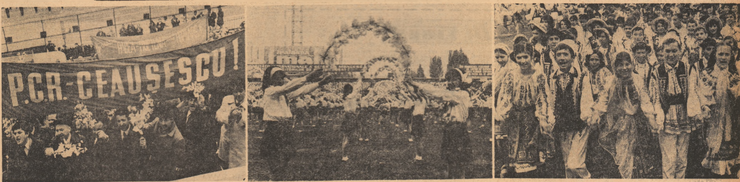
Secențe semnificative, înregistrate pe peliculă, de la marea adunare populară de pe stadionul Republicii, de la spectacolul cultural-sportiv la care și-au dat concursul 7.000 de tineri bucureșteni