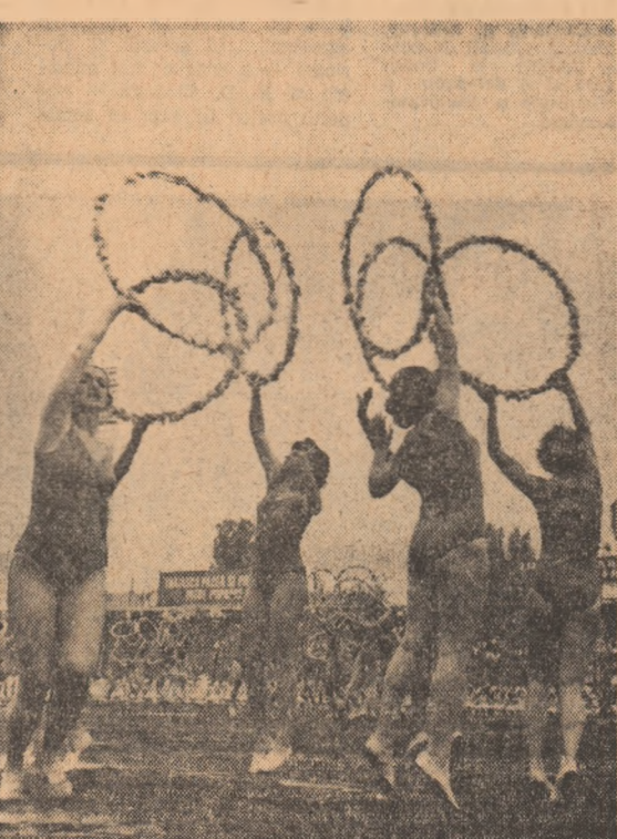
Repriza sportivă a ineditului spectacol de pe stadionul din Dealul Spirii continuă cu exerciții de gimnastică, o demonstrație de virtuozitate și grație.

La acest mări manifestări închinată muncii, entuziasmul și tinerii noastre.