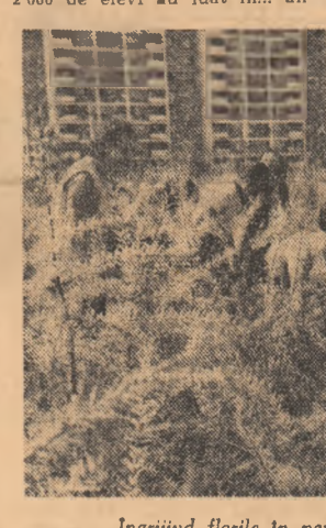
Îngrijind florile în pepiniera sectorului IV