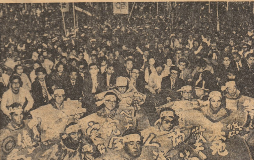
JAPONIA: Demonstrația la Tokio pentru înlăturarea imediată și completă a bazei militare americane de la Yokota.

ân a specificat: „Nu este deci îndeplinitor că această problemă se află în discuția Comitetului special, al cărui obiectiv final nu poate ignora mijloacele de înfăptuire a agresiunii. Ținînd seamă de consecințele deosebit de grave pe care le-ar avea actele de agresiune prin folosirea armelor de distrugere în masă, DELEGAȚIA ROMÂNĂ SE PRONUNȚĂ PENTRU INCLUDEREA ÎN DEFINIȚIA AGRESIUNII A UNEI PREDERII SPECIALE, CARE SĂ CONFINTEASCĂ OBLIGAȚIA STATELOR DE A NU FOLOSI SAU A NU AMENINȚA CU FOLOSIREA UNOR ASTEL DE ARME ÎN NICI O ÎMPREJURARE ȘI ÎN IMPORTANȚA NICIUNUI STAT”.