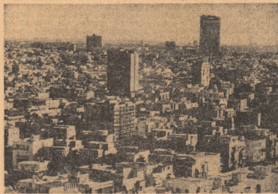
Israelul sărbătorește a 25-a aniversare a proclamării Independenței sale de stat. Fotografia noastră înfățișează o imagine a orașului Tel Aviv.

Tovarășul NICOLAE CEAUȘESCU, președintele Consiliului de Stat al Republicii Socialiste România, a trimis președintelui Israelului ZALMAN SHAZAR, următoarea telegramă: „A 25-a aniversare a statului Israel îmi oferă prilejul să adresez Excelenței Voastre și popoului Israelian sincere felicitări și cele mai bune urări de pace și progres.”