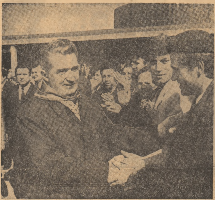
Conducătorul partidului și statului întâmpinat cu dragoste și respect de oamenii muncii

Incluzind în program unități industriale și agricole, șantiere, centre urbane, stațiuni de odihnă și tratament vizita a prilejuit o amplă și rodnică analiză la fața locului a problemelor privind dezvoltarea județului Bacău, perfecționarea activității în importante sectoare de activități economico-sociale