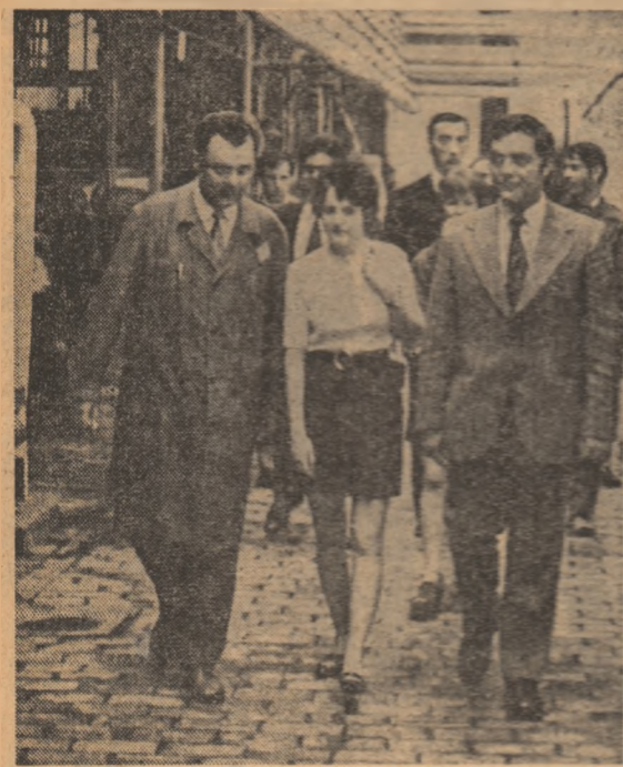
(Urmare din pag. 1)

marilor unități de acest fel din R.P. Bulgaria. Aici, oaspeților români le-au fost prezentate modalitățile de organizare științifică ale acestei unități dotată cu moderne sisteme informaționale și de conducere, și a fost vizitată una dintre cele trei fabrici ale întreprinderii. De asemenea, s-a realizat un fructuos schimb de opinii cu membrii ai U.T.C.D. de mare experiență proprie în mobilizarea și organizarea tinerilor în procesul de producție.