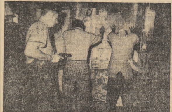
Descinderea poliției anti-drog la Shooting Gallery din New York: „o noapte istorică” pentru B.N.D.D.

● DUPĂ CONVORBIRILE din capitala U.R.S.S., consilierul președintelui Nixon pentru problemele securității naționale, Henry Kissinger, va face, miercuri, o escală de 24 de ore la Londra. Cu acest prilej, consilierul prezidențial va conferi cu primul ministru britanic, Edward Heath, și cu ministrul de externe, Alec Douglas-Home.