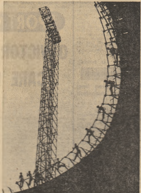
R.P. ALBANIA. — Pe șanberul noii uzine de urcă din orașul Fier.

Comentariile scot în evidență caracterul deschis și ospitalitatea poporului român.