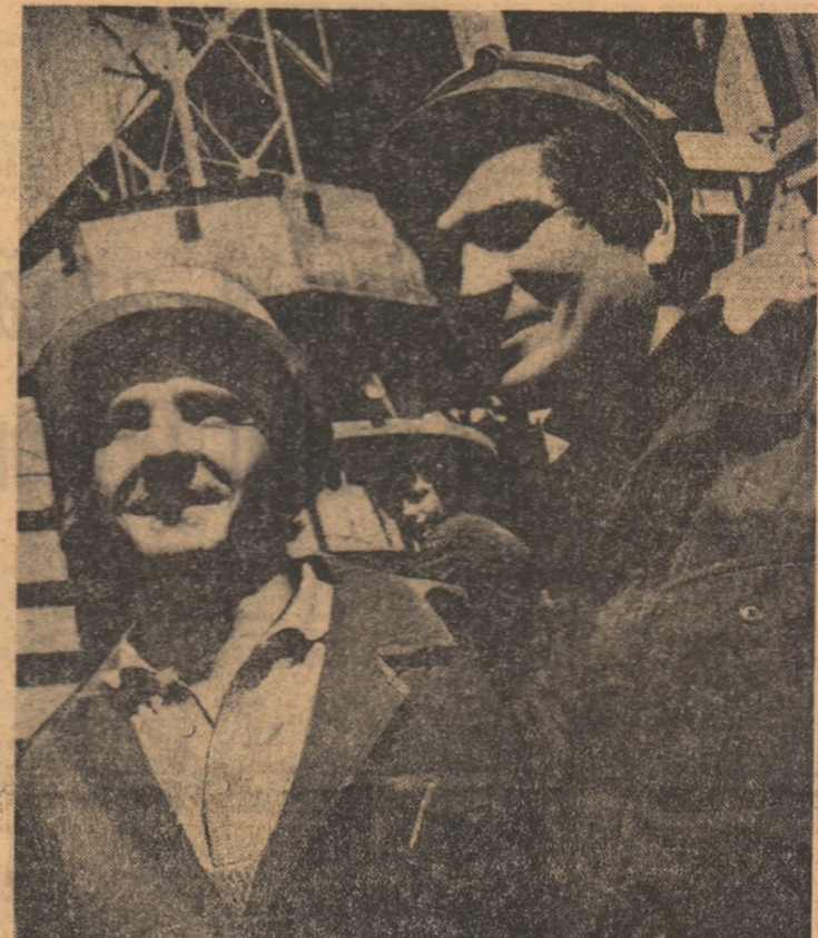
Fotografie de GHEORGHE CUCU