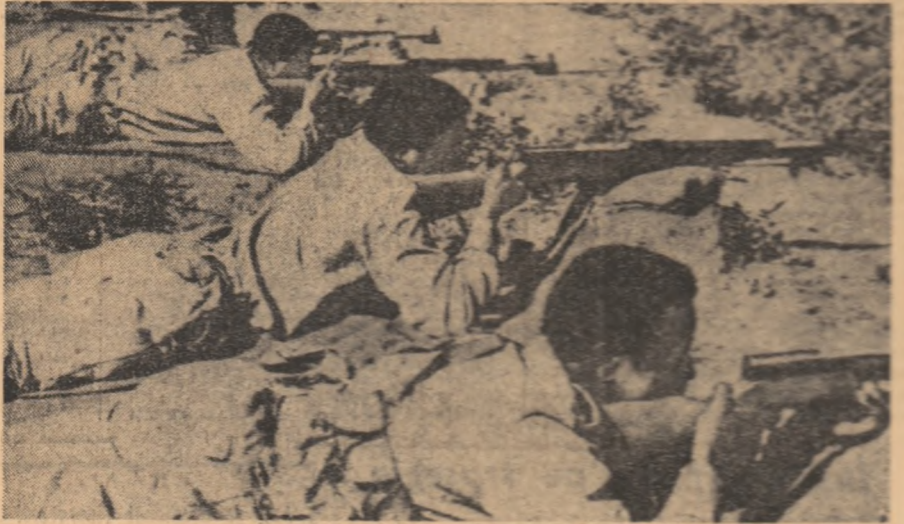
Patrioți englezi într-o tabără de instruire militară.