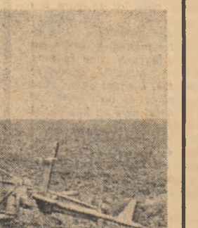
O semănătoare uitată în cîmp. Pe șoseaua Slatina—Pitești, la 4 kilometri de Valca Mare. A cui o fi? În aceste zile cînd se dă bătălia pentru încheierea semănatului, oare să nu mai aibă nimeni nevoie de ea?

se doborînd a fi acum asigurarea carburanților și adusul în cîmp a semînțelor. Sint necesare mai multe forte. În județul Olț mai sint de arat circa 10000 de hectare și de înșămîntat aproape 70000 hectare. Forța mecanică concentrată aici poate asigura încheierea executării acestor lucrări în cea mult 7 zile bune de lucru. Aceasta însă cu o condiție: organizarea perfectă a muncii. Acesta trebuie să fie imperativul activității tuturor specialiștilor și conducătorilor de unități agricole din acest județ.