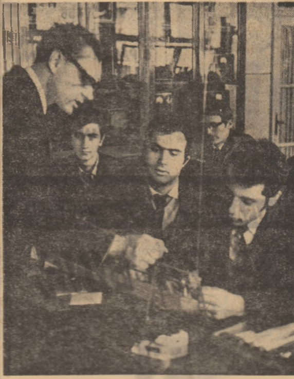
Ovă de fîncă la Liceul „Mihail Sadoveanu”