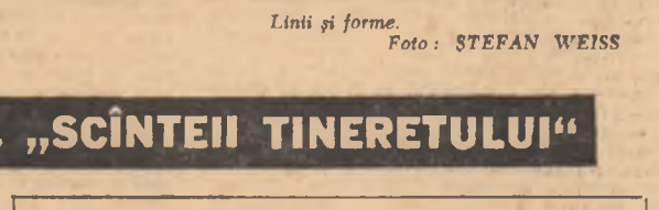
Linii și forme.

Cu o zi înainte de sosirea mea, organizația U.T.C. a secției generale își amînase adunarea generală. Motioul: din cei 100 de uteciști nu fuseseră prezenți decît 40. Acum discut cu unul din absenții de ieri și îmi spune fără nici o jenă că „a acut alite treburi, personale” și cu siguranță acesta este răspunsul pe care l-ar da multii din cei 60 de absenți. Într-o familie însă, dacă e întemeiat pe înțelegere și armonie, nu te gîndești în primul rînd la interesele tale, ci la întreaga familie. Dincolo, la „turbine”, dau peste doi tineri care deși lucrează de atena luni unul lîngă altul, la nici doi metri distanță, abia acum unul din ei află că celălalt nu e utecist. Mi se pare că o familie, tocmai pentru a se putea numi astfel, apază între condițiile sale de existență și o buna cunoaștere reciprocă, expresie a interesului pe care îl poartă tovarășului de lîngă tine.