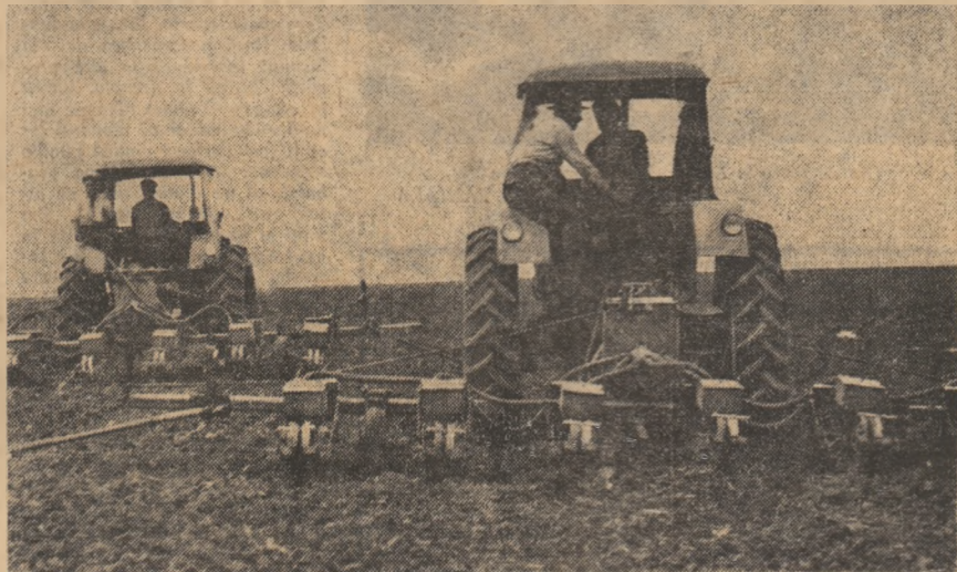
Temp prietnic, muncă din plin, calitate ireproșabilă.

Inițial, angajamentul agricultorilor din județul Olt a fost ca până la 30 aprilie să încheie sămânțatul porumbului. Pe o suprafață de mai bine de 150.000 hectare. Acest lucru nu a fost posibil datorită timpului nefavorabil din ultimele trei decade. Ajplouat aproape continuu. Iată motivul principal pentru care în aceste zile se depun eforturi deosebite pentru recuperarea rămănișilor în urmă la semănat. Forța mecanică a județului este în permanență mișcare — sensul deplasării fiind înspre unitățile agricole cu condiții mai grele și rămănișii în urmă cu arăturile și semănatul porumbului. Puterea de acțiune a crescut și ca urmare a celor aproape o mie de tractoare venite din stațiunile de mecanizare ale Doljului. S-a ajuns, astfel, la o concentrare de 8 tractoare la o sută de hectare planificate cu porumb de către cooperativele aflate în nord de oseasa Roșiori de Vede — Caracal. Timpul e frumos, iar condițiile de lucru sînt foarte bune.